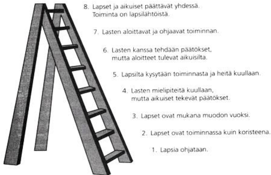
Kuvio 1. Osallisuuden tikapuut-malli (Hart, 1999, Eskelin & Marttilan, 2013 mukaan).

Mallin kolme alinta porrasta eivät varsinaisesti kuulu osallisuuteen, koska niissä korostuu aikuisen tarkoitusperistä lähtevä toiminta. Ensimmäiset kolme porrasta ovat lasten ajattelun ja sanomisien manipulointi, tunnelman luonti lasten osallistumisella ja lasten muodollinen kuunteleminen. (Hart, 1992; Turja, 2010.) Seuraavilla portailla lasten vaikutusvalta kasvaa ja heidän mielipiteensä otetaan laajemmin huomioon. Portaita edetessä lapset tulevat tietoisemmiksi toiminnasta ja sen tarkoitusperistä. Ylimmillä portailla lapset ovat tasavertaisesti mukana päätöksenteossa sekä toiminnan suunnittelussa. Lisäksi huomioidaan aikuisen ja lapsen keskinäistä toimijuutta ja vuorovaikutusta. (Turja, 2010.)