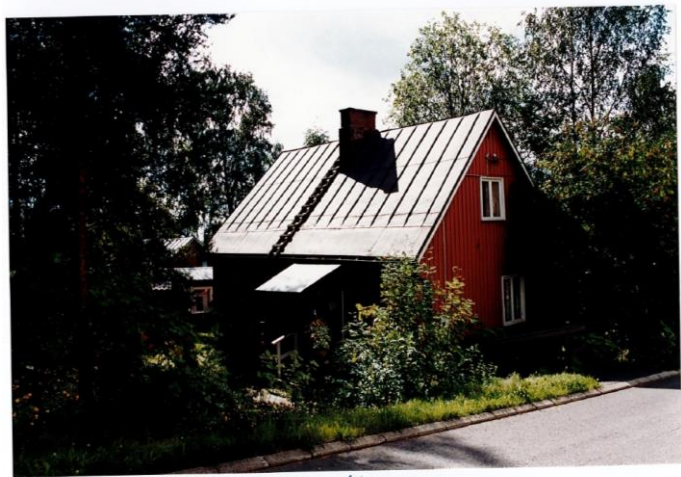
HOKKALANTIE 14 1998

Sääntelystä vapaan rakentamisen ja alueen rakennuskulttuurin seurauksena Jyskään muodostui etenkin 1930-luvulta 1960-luvun vaihteeseen varsin monikerroksinen rakennuskanta. Jyskän yksittäisille tonteille ominaista on myös tällainen kerrostuneisuus - monilla tonteilla seisoo useamman eri rakennuskauden rakennuksia, sillä kun uusia rakennuksia on ajan mittaan noussut samalle tontille, ei vanhoja ole purettu pois. 37 Keski-Suomen museon rakennusinventoinneista varhaisimpina esimerkkeinä Jyskän rakennuksista esiin nousee 1900-luvun alkupuoliskolla rakennetut mökit uudempien talojen pihapiirissä. 38 Toinen kerrostuma ovat 1930-luvun puiset funkkistyylliset asuinrakennukset, joita rakennettiin alueen alkuperäisille 1900-luvun alun tonteille muutamia. 39 Suurimman osan alueen rakennuskannasta muodostavat kuitenkin jälleenrakennuskauden puiset pientalot, eli niin sanotut rintamamiestalot tai tyyppitalot, joita on vuosien myötä korjattu ja laajennettu. Myös muutamia paritaloja ja kerrostaloja sijaitsee alueella. 40 Lähes kaikki Jyskän ennen 1960-lukua rakennetut pientalot ovat tontin kokoon nähden verrattain pieniä ja niiden rakennusmateriaalina toimii myös lähes poikkeuksetta puu. Suomessa rakennusmateriaalina puu on kautta historian ollut kaikkein halvin ja ei olekaan yllättävää että pääsoin työväenluokkaisessa Jyskässä rakentaminen on tehty mahdollisimman halvalla sekä