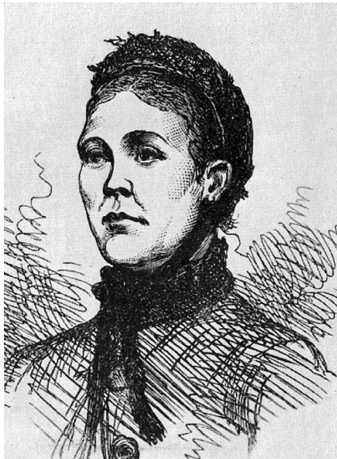
Catherine Eddowes kuvattuna The Penny Illustrated -sanomalehdessä, 1888.

Stride ja Catherine, Kate Eddowes (1842–1888) murhattiin samana yönä syyskuun lopulla 1888. Eddowes kuului hänkin työväenluokkaan. Hän sai kuitenkin käydä koulua, mikä ei ollut itsestäänselvyys työväenluokkaiselle, suuren perheen tyttarelle. Koulunkäynti ja koko lapsuus kuitenkin loppuivat 1850-luvulla molempien vanhempien kuoltua tuberkuloosiin. Sukulaisten nurkissa eläneelle Eddowesille maistui alkoholi, hän jäi kiinni varastamisesta ja elämä muuttui levottomaksi. Nuori nainen lyöttäytyi yhteen kiertelevän kauppamiehen Thomas Conwayn kanssa ja sai tämän kanssa lapsia, mutta pari ei koskaan mennyt naimisiin. Parisuhdeväkivalta, alkoholi ja köyhäntalot tulivat tutuiksi myös Eddowesille. Kuollessaan 46-vuotiaana Kate Eddowes oli jo moninkertainen isoäiti, jonka suhteet omiin lapsiin olivat katkenneet levottoman elämäntavan vuoksi.