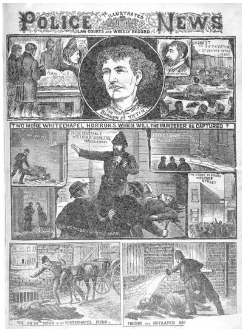
The Illustrated Police News kirjoitti Elizabeth Striden ja Catherine Eddowesin murhasta. 6.10.1888.

Viiden naisen eri elämäntarinoiden vaiheita on mahdollista hahmotella suhteellisen tarkasti ainakin neljän naisen kohdalta. Naisista ensimmäisenä murhattu Mary Ann, Polly Nichols (1845–1888) oli kirjapainossa työskennelleen sepän tytär, joka kävi koulua 15-vuotiaaksi asti. Sitten tulivat avioliitto, viiden lapsen syntymät ja ongelmat avioliitossa – ja lopulta levoton elämä taivasalla, yömajoissa ja köyhäintaloissa. Viimeisenä yönään elokuun lopussa 1888 Nichols oli humalassa ja yksin kadulla.