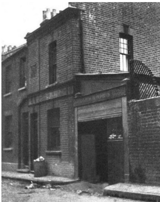
Katu, jolla Viiltäjä-Jack murhasi Mary Ann Nicholsin.