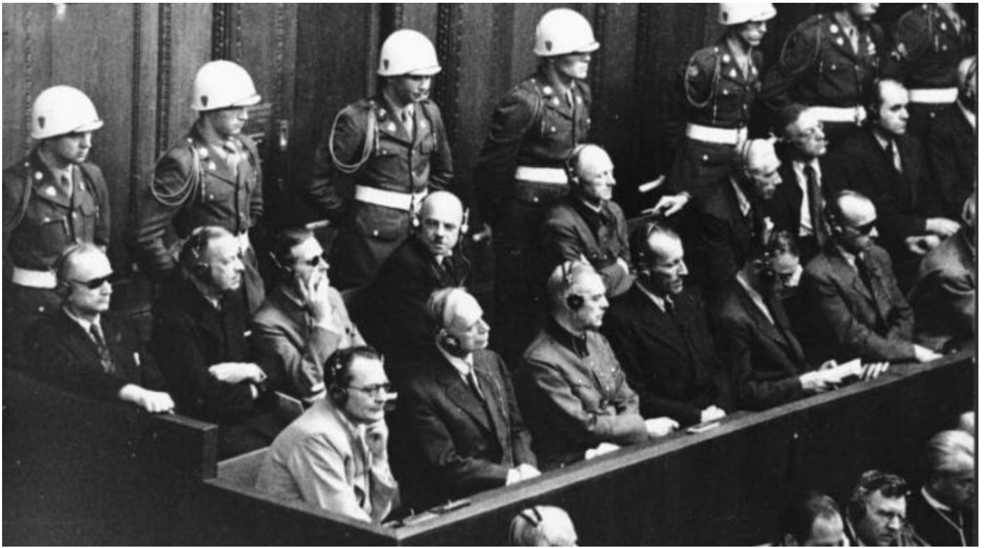
Natsijohtajia Nürnbergin oikeudenkäynneissä. Herman Göring aition alemmalla rivillä ensimmäinen vasemmalta.

Göringin maineen suhteen on kiinnostavaa havaita, että hän ei useiden muiden Hitlerin hallinnon hahmojen tavoin juuri esiinny uusnatsien propagandassa. Göringin maine on siis heille ilmeisen hankala, mahdollisesti koska hänestä ei ole mahdollista luoda vastaavalla tavalla myyttiä.