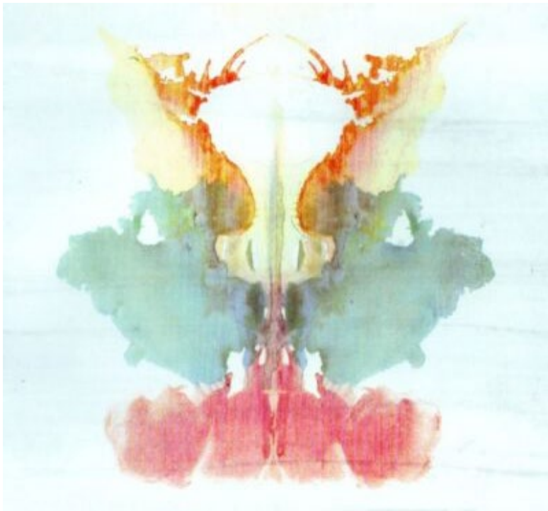
Natsijohtajille tehtiin muun muassa Rorschachin musteläiskätesti. Testin taulussa IX Göring näki ”lihavavatsaisen haamun.”