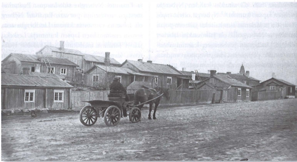
Näkymä Aninkaistenmäen puutaloalueelta vuodelta 1882.