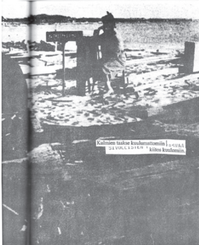
Kuva 2. Marjamäki 2010, 29.

valkoisia kuvia, printattua, kirjoituskoneella kirjoitettua sekä myös sanomalehdestä leikattua ja käsin kirjoitettua tekstiä.