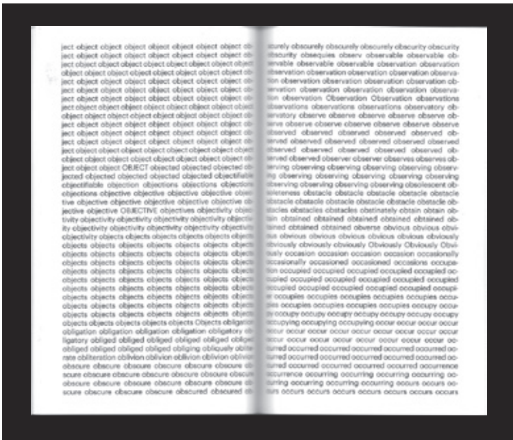
Kuva 8. Kuorinki 2012, sivunumerioimaton aukeama.

tekstin sedimenttien tieteelliseen erotteluun ja järjestämiseen. Kummassakin siis lähdetekstiin kuuluva elementti käännetään konseptuaalisen uudelleenasettelun välineeksi, konseptuaalisen teoksen tuottamaksi näkökulmaksi lähdeaineistoonsa. Myös rakenteellisesti teosten ideat muistuttavat toisiaan: molemmissa edeltävä teksti puretaan palasiksi (kirjaimiksi, sanoiksi) ja kootaan uudestaan koneellisesti. Tämä periaate on myös silmin nähden havaittavana tekstin poikkeuksellisessa ulkomuodossa. Teokset perustuvat lähdeteksin kielen armottomaan purkamiseen ja uudelleenkokoonpanoon ennalta päätetyn, hyvin mekaanisen (anagrammi, aakkosjärjestys) periaatteen mukaan. Molemmat teokset