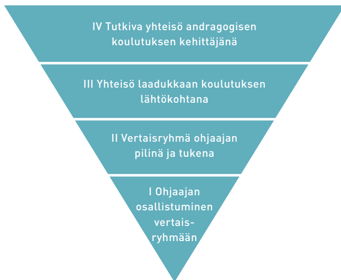
Kuvio 2. Ohjaajan vertaisryhmää andragogisessa toimintaympäristössä kuvaavat kategoriat.

Kuitenkin myös kaksi kirjoittajaa tuo esiin sen, että aina yhteisesti sovitut asiat eivät toteudu sovittulla tavalla: "Joskus on jäänyt harmittamaan, kun palaverissa on sovittu yhteisesti jotakin, mutta niitä ei olekaan viety eteenpäin tai toteutettu." (vastaaja 6).