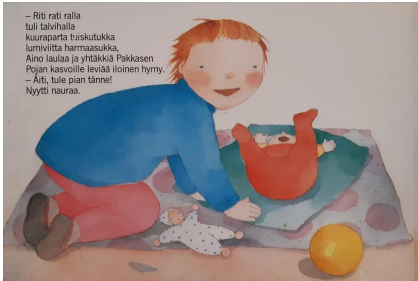
Kuva 2: Aino ja pakkasen poika , Kristiina Louhi, 1985, 5.painos. Tammi.

Kuva 2 on teoksesta Aino ja pakkasen poika (1985). Myös tässä toteutuu tunnetaitojen hierarkia, oikeastaan vielä konkreettisemmin kuin kuvassa 1. Aino tunnistaa oman tunteensa ilon ja innostuksen, osaa siirtää sen pikkuveljelleen ja osaa tunnistaa sen hänestä. Hän myös reagoi ja haluaa jakaa tunnekokemuksen muiden kanssa. Se korostaa tunnetaitojen ymmärrystä ja hallitsemista.