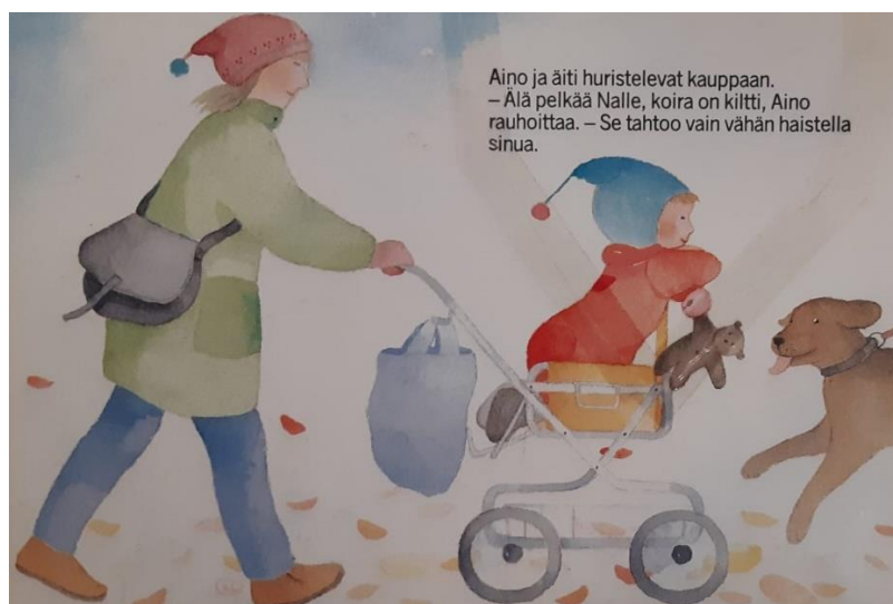
Kuva 3: Ainon kanssa , Kristiina Louhi, 1984, 4.painos. Tammi.

Kuva 3 on teoksesta Ainon kanssa (1984). Tässä tilannekontekstissa eli kauppaan menemisessä keskiössä ei ole koko tunnetaitojen läpikäyminen ja selkeä siirtyminen tunteesta sen tiedostamiseen, reaktioon ja tunteen muuttumiseen. Vaan keskiössä on Ainin jo hallitsemat tai kokemat taidot, niiden merkitysten ymmärtäminen ja opettaminen toiselle. Mikä oikeastaan sijoittuu tunnetaito-hierarkian ylimmän tason yläpuolelle eli oman osaamisen siirtämistä toiselle.