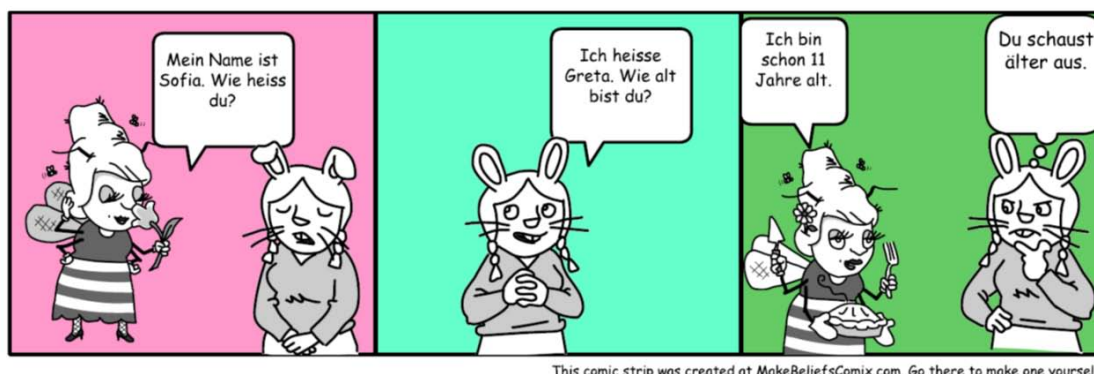
Abbildung 3. Die erste schriftliche Aufgabe im Herbst 2010.

durch so eine Aufgabe, da sie selbst auswählen können, welche Informationen sie von sich selbst preisgeben möchten. Zuletzt entwickelten die SchülerInnen selbst einen Comic-Strip im Internet (Phase 3) (siehe Abbildung 3).