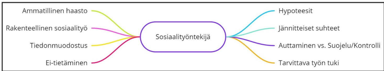
KUVIO 3. Suhdeperustaisen työn vaikutuksia sosiaalityöntekijän työhön