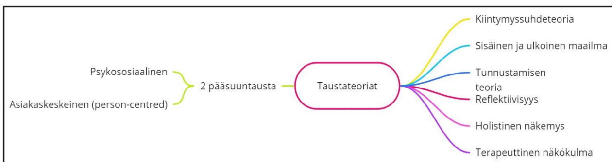
KUVIO 1. Suhdeperustaisuus -käsitteen taustateoriat

Kahden pääsuuntauksen lisäksi tutkijat ovat yhdistäneet muita sosiaalityön teorioita ja lähtökohtia suhdeperustaisuuteen ja tutkimuksiinsa. Suhdeperustaisuutta halutaan kehittää, jotta se ei kohtaa samanlaisia vaikeuksia kuin 1970-luvulla. Tutkijoilla ei ole yhtä tiettyä näkökulmaa, vaan avuksi on otettu useita eri teorioita.