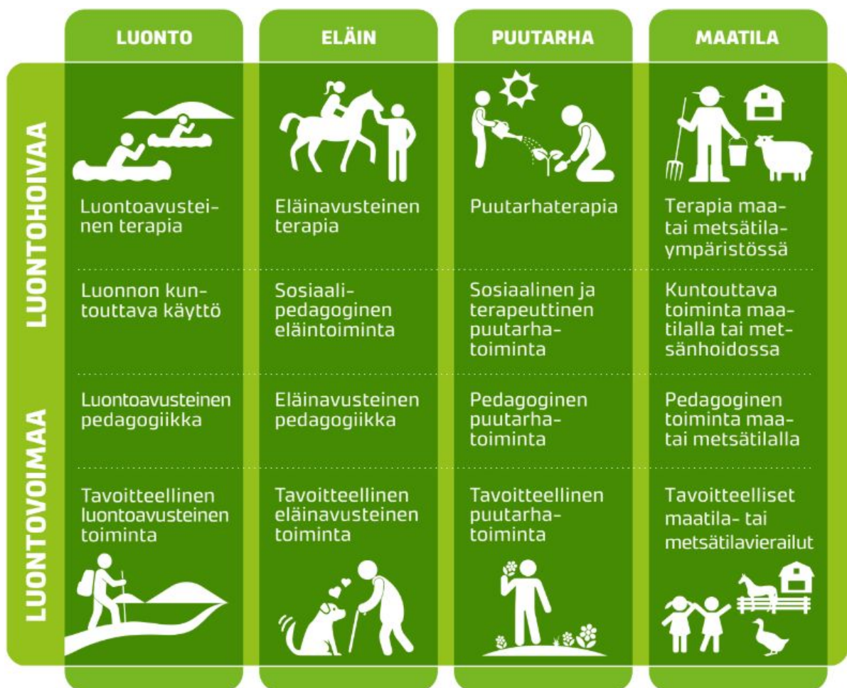
Kuvio 1. Esimerkkejä LuontoHoivan ja LuontoVoiman toimintamuodoista (Vehmasto, Kettunen & Green Care Finland ry 2018).

Seuraavassa kuviossa (kuvio 1) on vielä esitetty yhteenvetoa erilaisesta luontoon perustuvasta toiminnasta ja niiden jakautumisesta LuontoVoiman ja LuontoHoivan palveluiksi.