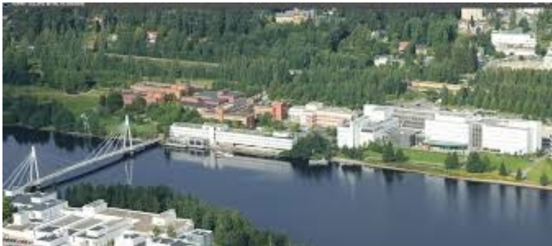
A finnországi Jyväskylä Egyetem

A heti egyszeri 90 perces csoportos kontaktórák mellett az online tanuláshoz az egyetem Moodle felülete állt a diákok rendelkezésére, amely feltöltött leckéi hetente körülbelül 90 perces aktív tanulást igényeltek. Természetesen, mivel a tanulók egyéni zenei készség szintje ismeretlen volt számomra, ez az idő csak irányadó volt. Az anyag terjedelme és tartalma hétről-hétre változott a tanulók visszajelzései (a Moodle felület fórumán közzétett nyílt blogok) és a saját tanítási tapasztalataim alapján, amit mind az élő csoportos órákon, illetve az online beadandó feladatok teljesítése kapcsán észleltem.