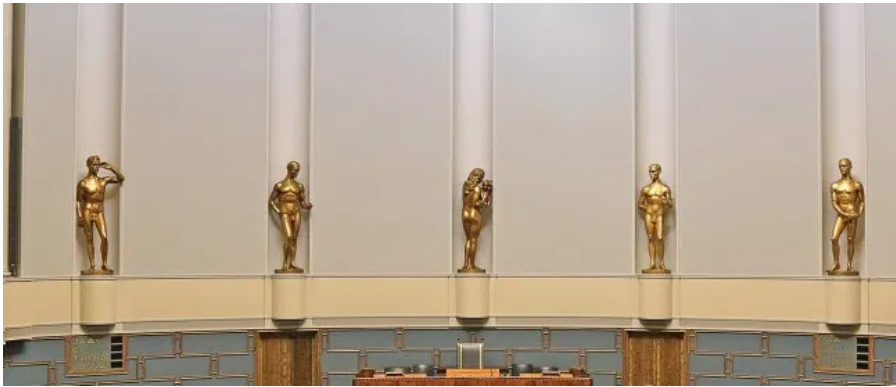
Tiina Tuukkanen (CC BY-SA 4.0)

📅 1.7.2020 👤 POLIITIKASTA LEHTI 📄 ARTIKKELIT, JOUNI TILLI 💬 1