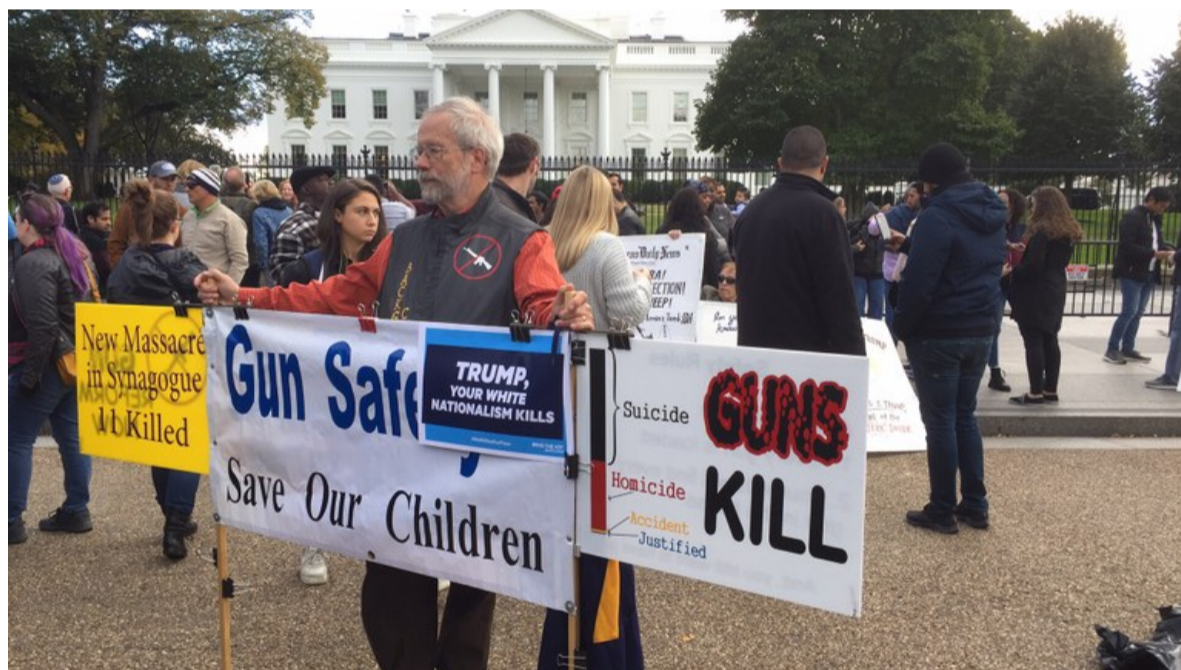
Mielenosoitus vuoden 2018 välivaalien aikaan.

Supertiistaista on nyt kulunut kolmisen kuukautta ja vaalasetelmat ovat muuttuneet. Koronakriisi on noussut keskeiseksi vaalikysymykseksi. Virus on käytännössä keskeyttänyt sekä demokraattien esivaalit että presidentin massiiviset kampanjatilaisuudet. Se on ajanut Yhdysvaltain talouden syöksykierteeseen. Kymmenet miljoonat amerikkalaiset ovat joutuneet työttömiksi. Rajoituksia kannattaneet kuvernöörit ovat joutuneet presidentin tulilinjalle, ja liittohallituksen suhteet osavaltioihin ovat tulehtuneimmat vuosikymmeniin.