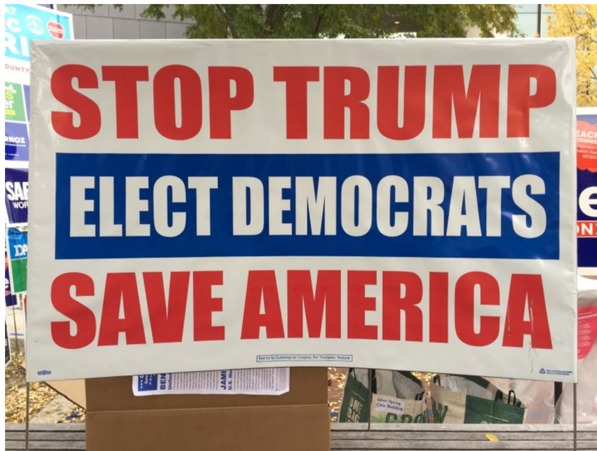
Vaalibanderolli vuoden 2018 välivaalien aikaan.

Huolimatta konservatiivien kannalta loistavista nimityksistä republikaanien rivit eivät ole säilyneet täysin yhtenäisiä. Washingtonista kantautuneiden huhujen mukaan yksi, jos toinenkin republikaanivaikuttaja katsoo kaihoisasti senaattori Mitt Romneya, joka äänesti tammikuussa ainoana republikaanina presidentin viraltapanon puolesta. Kulissien takaisissa keskusteluissa on todettu suoraan, että koronakriisin hoitaminen olisi paljon vakaampaa, jos presidenttinä olisi nykyinen varapresidentti Mike Pence. Republikaanivaikuttajat pelkäävät presidentin vetävän myös heidät alas marraskuun 2020 vaaleissa. Mikäli presidentti ei onnistu kääntämään talouden syöksykierrettä, sekä hän että monet muut republikaanit joutuvat työttömiksi. Tätä kirjoittaessa tilanteen muuttamiseen on aikaa 145 päivää.