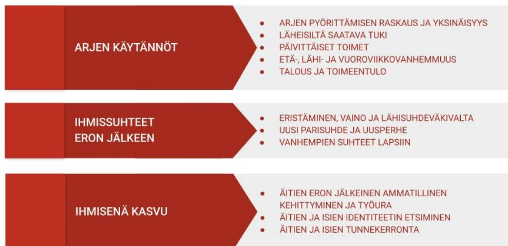
KUVIO 1. Äitien ja isien eroarjen kerronnan jakautuminen pää- ja alaluokkiin.

Se, mitä isät ja äidit kertovat eron jälkeisestä arjestaan ja millaista lapsiperheen eron jälkeinen arki isien ja äitien kerronnassa on, jakautuu lehti- ja blogiaineiston mukaan seuraaviin pääluokkiin: arjen käytännöt, ihmissuhteet eron jälkeen ja ihmisenä kasvu, joihin liittyy useita alateemoja. Arjen käytännöt jakautuu viiteen alaluokkaan: 1) arjen pyörittämisen raskaus ja yksinäisyys, 2) läheisiltä saatava tuki, 3) päivittäiset toimet, 4) etä-, lähi- ja vuoroviikkovanhemmuus sekä 5) talous ja toimeentulo. Ihmissuhteet eron jälkeen sisältää kolme alaluokkaa: 1) eristäminen, vaino ja lähisuhdeväkivalta, 2) uusi parisuhde ja uusperhe sekä 3) vanhempien suhteet lapsiin. Ihmisenä kasvun kolme alaluokkaa ovat: 1) äitien eron jälkeinen ammatillinen kehittyminen ja työura, 2) äitien ja isien identiteetin etsiminen sekä 3) äitien ja isien tunnekerronta.