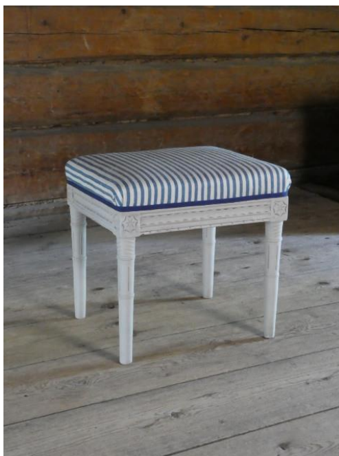
Kuva 5: Taburetti. Taburetti oli yleinen huonekalu aatelisten kartanoissa ja kaupunkitaloista, sillä jokaisessa perukirjassa sellainen mainitaan. Kuvan taburetti on myöhäiskustavilainen harmaaksi maalattu suorakaiteen muotoinen pehmustettu istuin noin vuodelta 1800. Samankaltaisia tuoleja on ollut Tervikin kartanon paraatimakuuhuoneessa.