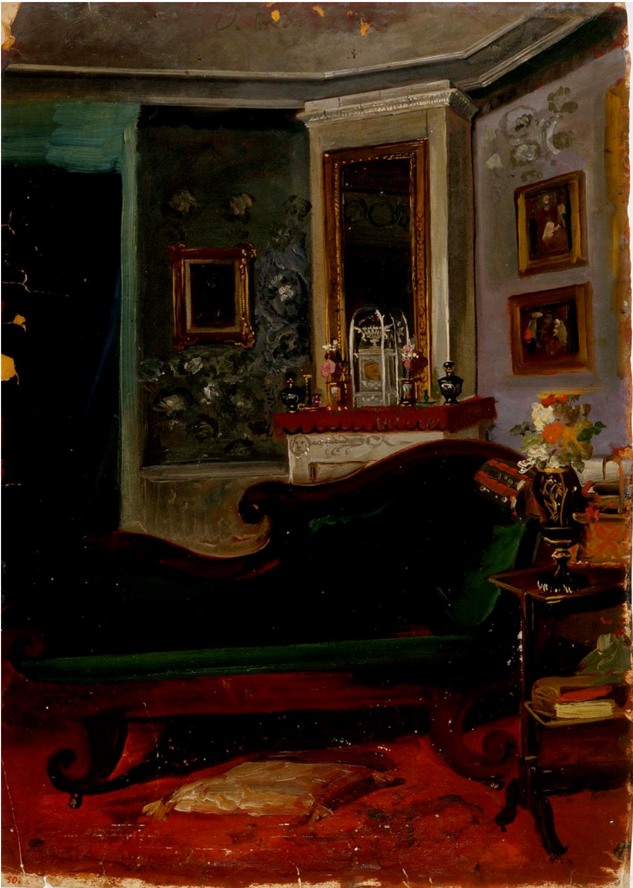
Kuva 7: Robert Wilhelm Ekman: Vihreä sohva.