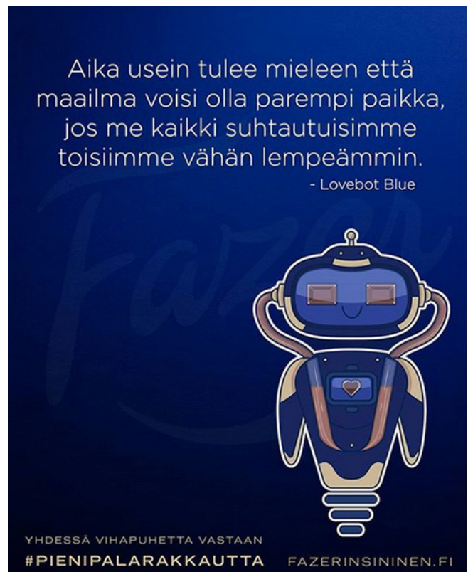
Kuva 1. SlackBot (Lähde: Tutkimusryhmän oma Slack-alusta) ja LoveBot Blue Instagramissa (Fazer, 8.11.2018).