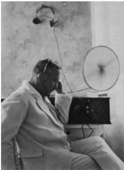
Relander kuuntelee radiota Kultarannassa.