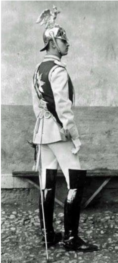
Chevalierkaartin kornetti Carl Gustaf Mannerheim vuonna 1891.