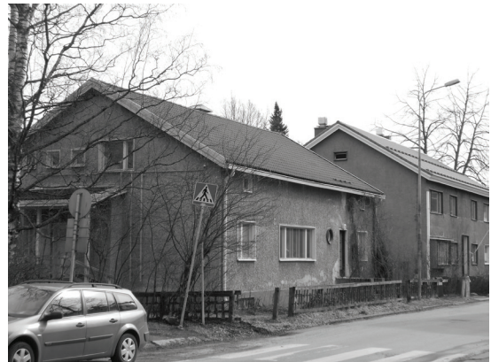
Kuva 3. Saidin tapauksessa paikan tärkeys rakentui vanhojen talojen pittoreskista kauneudesta, henkilökohtaisista unelmista ja halusta säilyttää kulttuuriympäristön monikerroksisuus.

Jasminin tärkeäksi paikaksi nimeämän Kuokkalan sillan (kuva 4) valintamotiivit rinnastuvat lähtö-