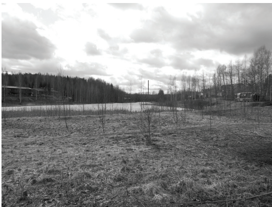
Kuva 2. Mikko koki arkisen koulumatkansa varrelle sijoittuvan maiseman kauniiksi ja siksi tärkeäksi.

Samankaltainen esteettisesti painottunut motiivi löytyy myös Saidilta, jonka tärkeäksi nimeämän paikan kuvaus (kuva 3) koostuu kahdesta Jyväskylän keskusta-alueen laitamilla sijaitsevasta asuintalosta. Valokuvauksesta kiinnostunut Said perusteli