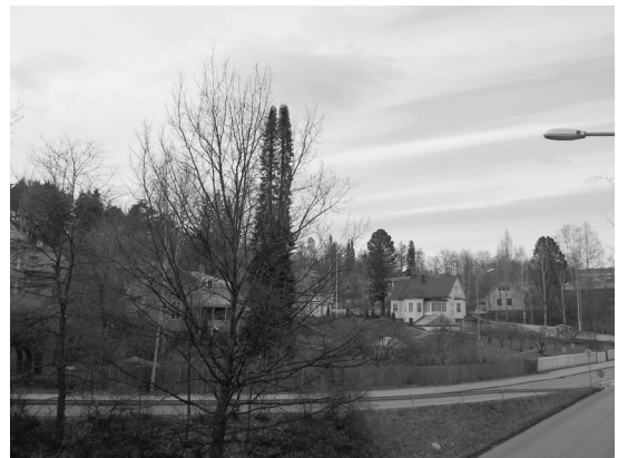
Kuva 5. Pertin paikan valinnassa korostui huoli hänelle tärkeän maiseman katoamisesta.

Perti puolestaan valitsi tärkeimmäksi paikakseen yliopiston hallitseman Seminaarinmäen ja Jyväsjärven väliin sijoittuvan Älylän huvila-alueen (kuva 5). Valtakunnallisesti merkittäväksi rakennetun kulttuuriympäristön kohteeksi arvetettu Älylä koostuu pääasiassa 1900-luvun alkupuolella rakennetuista huviloista, joita on aikojen saatossa kuvattu suhteellisen paljon kanonisoituneessa Jyväskylä-kuvastossa. Tämän johdosta aluetta voidaan pitää perustellusti yhtenä yleisesti tunnettuna jyväskyläläisenä kulttuuriympäristönä. Perusteluissaan Perti kertoi Älylän tärkeyden palautuvan hänen lapsuudessaan omaksumiinsa Jyväskylä-mielikuviin, joissa Älylä ja yliopisto muodostivat historiaa ja sivistystä henkivän perustan ”Suomen Ateenaksi” kutsutulle kaupungille. Varsinainen syy Pertin valintaan on kuitenkin johdettavissa pelkoon, jossa kaupungin kaavailemat kehittämissuunnitelmat uhkaavat hänen mielikuvansa mukaista käsitystä alueen esteettisesti ideaalista