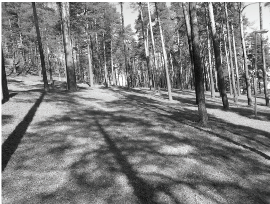
Kuva 7. Harju on Leenalle tärkeä vapaa-ajan viettopaikka, jossa yhdistyvät luonnon kauneus, rauhallinen tunnelma ja nostalgiset muistot.

Laurin ja Juhan valintamotiivit ovat edellä mainittujen tapaan hyvin moniulotteisia, ja niistä löytyy sekä toiminnallisiin, sosiaalisiin, nostalgisiin että esteettisiin ulottuvuuksiin viittaavia piirteitä. Laurin ja Juhan tapauksissa on myös mielenkiintoista huomata, miten paikan valinnan motiiveista voidaan valokuvahaastatteluun ja visuaaliseen analyysiin pohjautuvan menetelmän avulla löytää epäsuoria linkityksiä kanonisoituun kuvastoon.