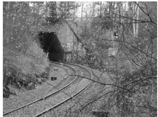
Kuva 8. Kuvan alikulkutunneli edustaa Laurille rajapyykkiä, joka kytkeytyy hänen elämänsä vaiheisiin lapsuudesta eläkeikään.

Laurin valintamotiivit näyttäisivät siis palautuvan toiminnallisiin ja sosiaalisiin sekä ennen kaikkea