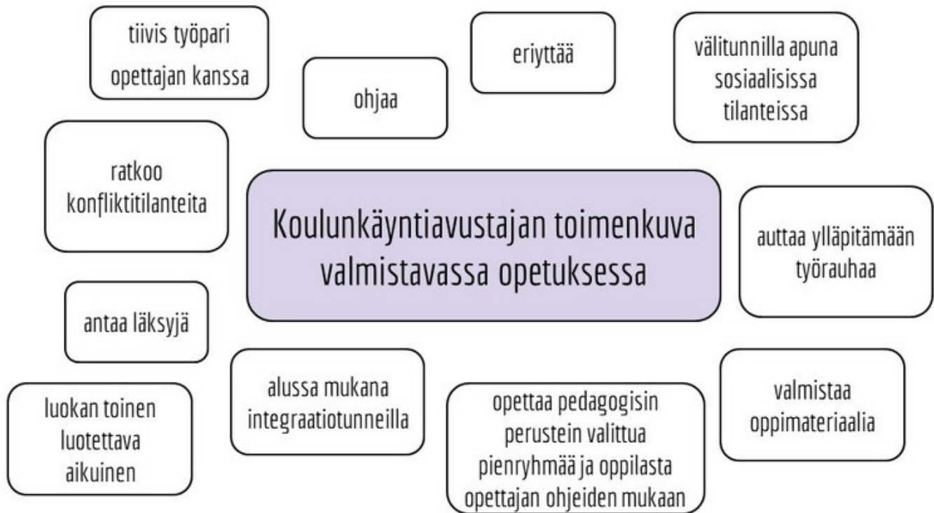
Kuva 6. Koulunkäynninohjaajan toimenkuva valmistavassa opetuksessa

Kyselyyn vastanneista puolet kokivat, että heillä ei ole riittävästi avustajaresurssia. Eräs opettaja kuvaili avustajan tärkeyttä näin: