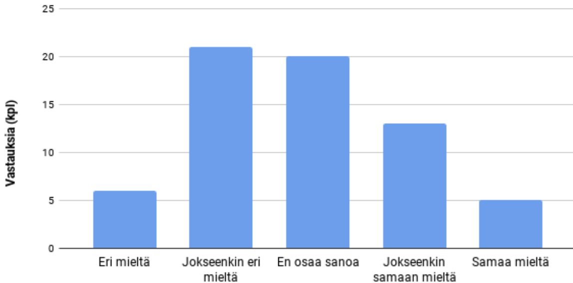
Kuva 2. Koulussa valmistavan oppilaan kielitaidon tasoa ei huomioida tarpeeksi.

Kyselyyn vastanneista opettajista iso osa kaipaakin täydennyskoulutusta. Vaikka suurin osa vastaajista koki, että heillä on riittävästi tietoja ja taitoja vastasaapuneen oppilaan opettamiseen, he samalla toivoivat S2-opintoja sekä monikulttuurisuus- ja kielitietoisuusopintoja oman ammatillisen kehittymisensä tueksi. Lisäksi moni koki täydennyskoulutustarvetta erityisesti tuen järjestämiseen, erityispedagogiikkaan, eriyttämiseen ja tunne- ja mielenterveystaitoihin liittyen. Monet vastaajat nimittäin kokivat, ettei heillä ole riittävästi valmiuksia tukea vastasaapuneen oppilaan tunne- ja mielenterveystaitoja (ks. kuva 3). Vastaajat toivoivat myös erillisiä valmistavan opetuksen opintoja.