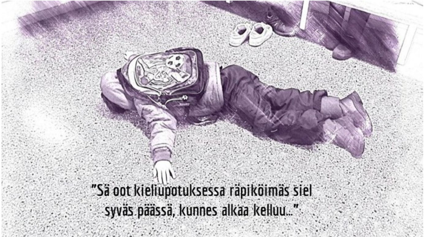
Kuva 4. Haastateltu rehtori kuvaili tilannetta, jossa riittävästi tukea ei ole.

Selvityksessä annetuissa suosituksissa todetaan, että kaikkea valmistavaa opetusta ei voi järjestää inklusiivisesti. Mikäli oppilaalla ei vielä ole riittävästi kielitaitoa toimiakseen perusopetusryhmässä ja resurssit ovat puutteelliset, on vaarana päätyä tilanteeseen, joka ei tue oppilaan suomen kielen oppimista, kotoutumista ja identiteetin kehittymistä parhaalla mahdollisella tavalla (ks. kuva 4).