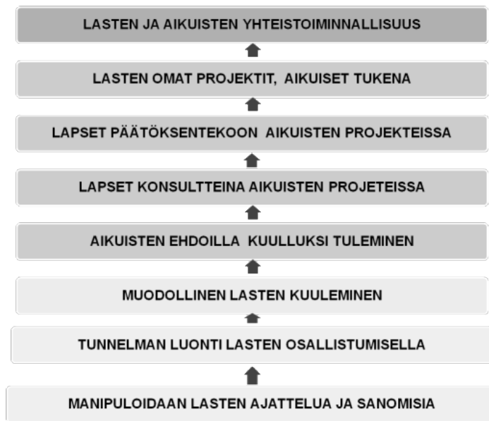
KUVIO 1. Hartin (1992) lasten osallisuuden portaat Turjan (2011, 27) suomentamana.

Shier (2001) puolestaan jakaa lapsen osallisuuden viiteen tasoon (ks. kuvio 2). Ensimmäisellä tasolla lapset tulevat kuulluiksi, ja toisella tasolla lapsia tuetaan ilmaisemaan mielipiteitään. Kolmannella tasolla lapsen mielipiteet otetaan huomioon päätöksiä tehtäessä. YK:n lapsen oikeuksien sopimuksessa edellytetään tämän tason osallisuuden toteutumista. Neljännellä tasolla lapsi otetaan mukaan päätöksentekoprosessiin, ja tätä vaihetta voidaan kuvata siirtymisenä kuulemisesta aktiiviseen osallisuuteen päätöksenteossa. Viidennellä tasolla lapsi ja aikuinen jakavat vallan ja vastuun päätöksenteossa, mikä edellyttää sitä, että aikuiset luovuttavat valtaansa ja vastuutaan lapselle. Tässä tasossa ei kuitenkaan ole kyse siitä, että lapsen tulisi ottaa itselleen sellaista vastuuta, jota hän ei halua tai joka on sopimatonta hänen kehitystasolleen ja ymmärrykselleen. (Shier, 2001.)