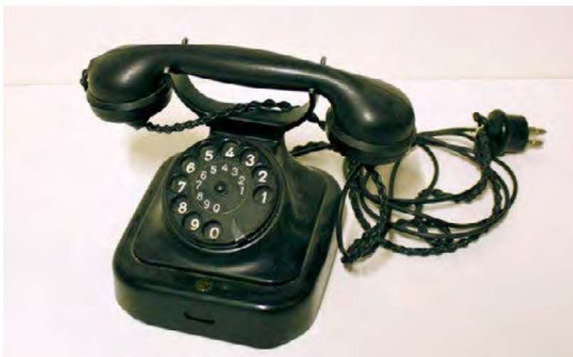
Numerolevyllinen pöytäpuhelin, luuri kannattimissa koneen päällä (1930-luku). Hotelli- ja ravintolamuseo.

Länsimaisissa yhteiskunnissa yksilöitten mahdollisuutta yrittäjyyteen edistetään institutionaalisilla järjestelmillä. Yrittäjyys saa monenlaisia muotoja. Institutionaalisilla muutoksilla pyritään siihen, että tuottava ja hyödyllinen yrittäjyys lisääntyisi.