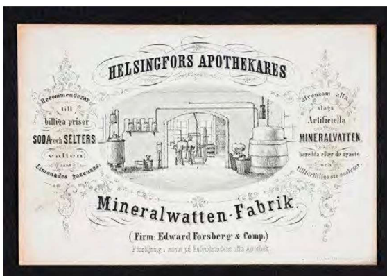
Helsingfors Apothekares Mineralwatten-Fabrik -liikekortti. Helsingin kaupunginmuseo.

Yritykset ja kauppahuoneet eivät olleet osakeyhtiömuotoisia. Suomessa oli 1700-luvulla perustettu vain yksi osakeyhtiö, joka oli vuonna 1762 aloittanut Hertonäs Fajansfabriks Bolag. Ennen vuoden 1895 osakeyhtiölakia oli perustettu noin 60