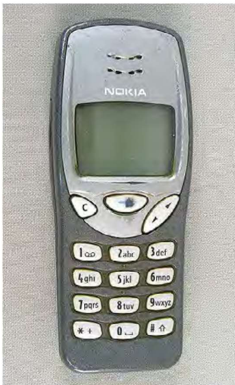
Nokia 3210 -mallinen kännykkä. Turun museokeskus.

Globaalissa kapitalismissa omistajuutta on siirtynyt perheiltä, suvuilta ja yrityksiltä kansainvälisille sijoittajille. Siihen on vaikuttanut pääomamarkkinoiden vapautuminen ja Suomen liittyminen Euroopan unionin talousalueeseen. Ulkomaalaisomistuksen vapauttaminen lisäsi finanssivetoisuutta suomalaisiin yrityksiin. Suomalaisia yrityksiä on listattu ulkomaiden pörssiin. Omistajien tavoitteet ja sijoittajien arvot ( shareholder value ) vaikuttavat yritysten johtamiseen. 280