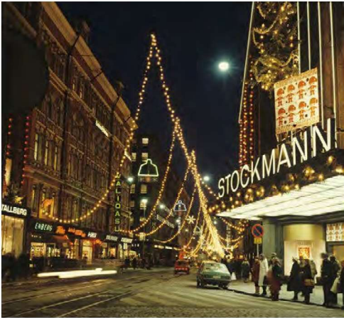
Aleksanterinkatu, Helsinki.

suuria tukkuliikkeitä. Pienyrittäjien määrä alkoi lisääntyä. 186