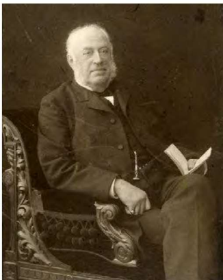
Fredrik Idestam.