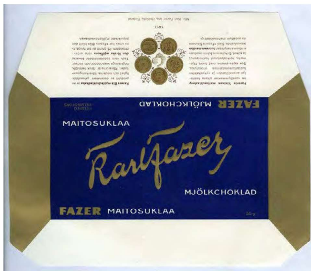
Fazerin maitosuklaan etikettikääreitä.