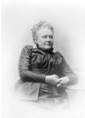
Minna Canth.