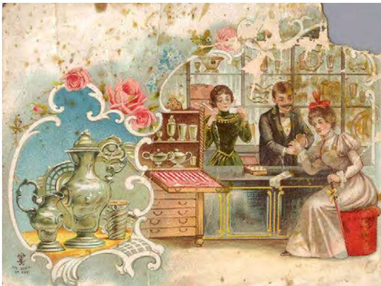
Kultasepäänliikkeen liikekortti.

1904) ja osuuskassojen OKO (perustettu 1902). Osuustoiminnan ohella syntyi myös osuustoiminnallinen Pellervo-ryhmä. 161