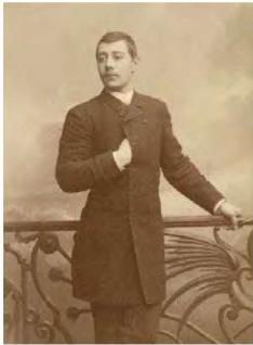
Karl Fazer.