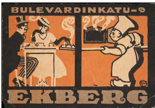
Cafe Ekbertin liikekortti vuodelta 1917.

Ensimmäinen jakso kuvaa aikaa ennen elinkeinovapautta, jolloin luotiin perusta suomalaiselle yrittäjyydelle. Toisena jaksona voidaan pitää suomalaisen yrittäjäkunnan ja yrittäjätoiminnan laajentumisen vaihetta (noin 1860–1939). Suuret uudistukset, kuten rautatielaitoksen rakentaminen ja pankkilaitos, vaikuttivat liiketoiminnan kehittymiseen. Maailmansotien välisenä aikana Suomi itsenäistyi ja maa alkoi demokratisoitua. Ulkomaankauppa laajeni merkittävästi. Kolmas vaihe (noin 1944–1959) kuvaa toisen maailmansodan jälkeistä jälleenrakennuksen Suomea, jolloin teollistuminen pääsi vauhtiin ja rakennustoiminta lisääntyi. Neljäs vaihe (noin 1960–1990) kuvaa aikaa, jolloin Suomi muuttui kiihtyvällä vauhdilla agraariyhteiskunnasta teollisuusyhteiskunnaksi ja jolloin globaali kapitalismi alkoi yleistyä ja korkean teknologian käyttö lisääntyi. Elintason nousu näkyi lisääntyneenä kulutuksena. Kotimainen kysyntä kasvatti pk-sektoria ja vauhditti talouden yleistä kehitystä. Viidettä vaihetta voi