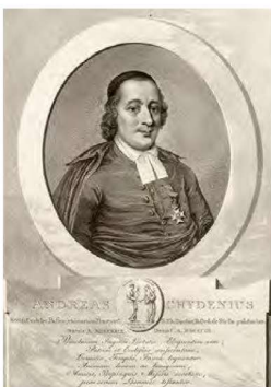
Antti Chydenius.

Kokkolan kirkkoherra, teologian tohtori Anders (Antti) Chydenius oli varhainen Suomen elinkeinovapauden edistäjä ja puolustaja, ”Pohjolan Adam Smith”. Chydenius vastusti taloudellisia monopoleja ja etuoikeuksiin perustuvaa merkantilistista talousjärjestelmää. Hänen liberalistiset ajatuksensa vaikuttivat elinkeinovapauden säätämiseen, jolla oli ratkaiseva merkitys vapaan yrittäjätoiminnan leviämiseen.