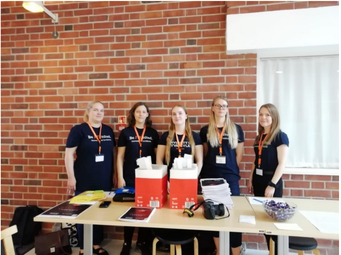
The West Networkin konferenssin avustajakaarti.

Konferenssiavustajana pääsee kuuntelemaan esitelmiä niin paljon kuin muilta tehtäviltä ennättää, mutta samalla täytyy olla myös valmiina avustamaan esimerkiksi esitelmänpitäjän mikrofonin laitossa tai tietokoneongelmissa. Itse autoin myös eksyneitä ja muuta apua tarvitsevia vieraita infotiskillä. Tutkijoihin tutustuminen on konferenssin parasta antia, jossa hyvästä kielitaidosta ja tilannetaajasta on paljon hyötyä. Konferenssissa täytyy myös olla jatkuvasti selvillä siitä, mitä ohjelmassa ja ohjelman ulkopuolella tapahtuu ja olla valmiina auttamaan vieraita, sillä avustaja on yleensä se, jolta kysytään takseista, saleista tai muista käytännön asioista. Vasta infotiskin hiljennettyä pääsee avustajakin kuuntelemaan tutkijoiden tarinoita maailmasta.