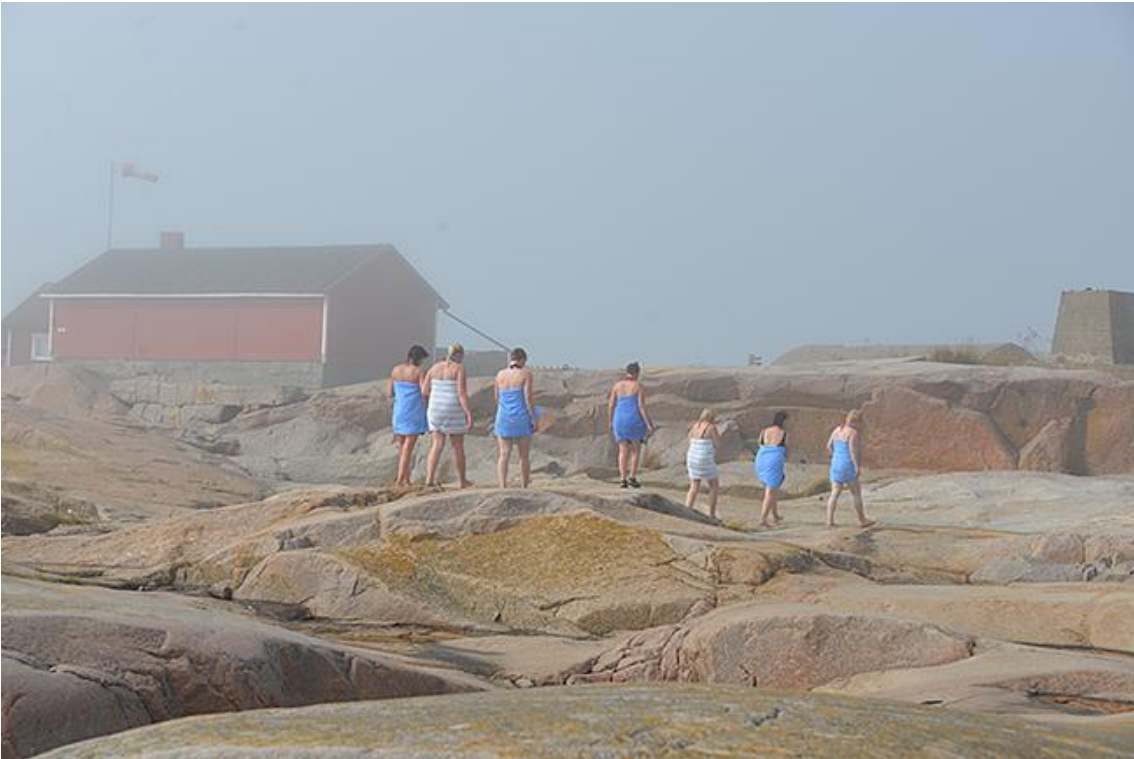
Kuva 4. Kohteena Maailma -blogin kuva saunojista