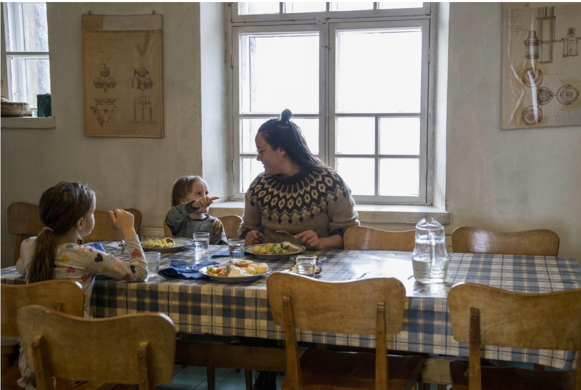
Kuva 5. Lähiömutsi-blogin kuva yöpyjille tarjotusta illallisesta