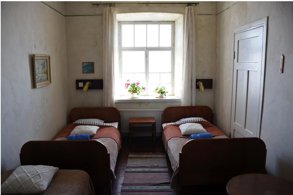
Kuva 1. Ajatusmatkalla-blogin kuva majoitustiloista

*Muu: retkiluistelijoita, lossi, oman veneen sisältä, merimerkki, postilaatikko, rakennusten yksityiskohtia, Rosalan viikinkikylä, varusteita.