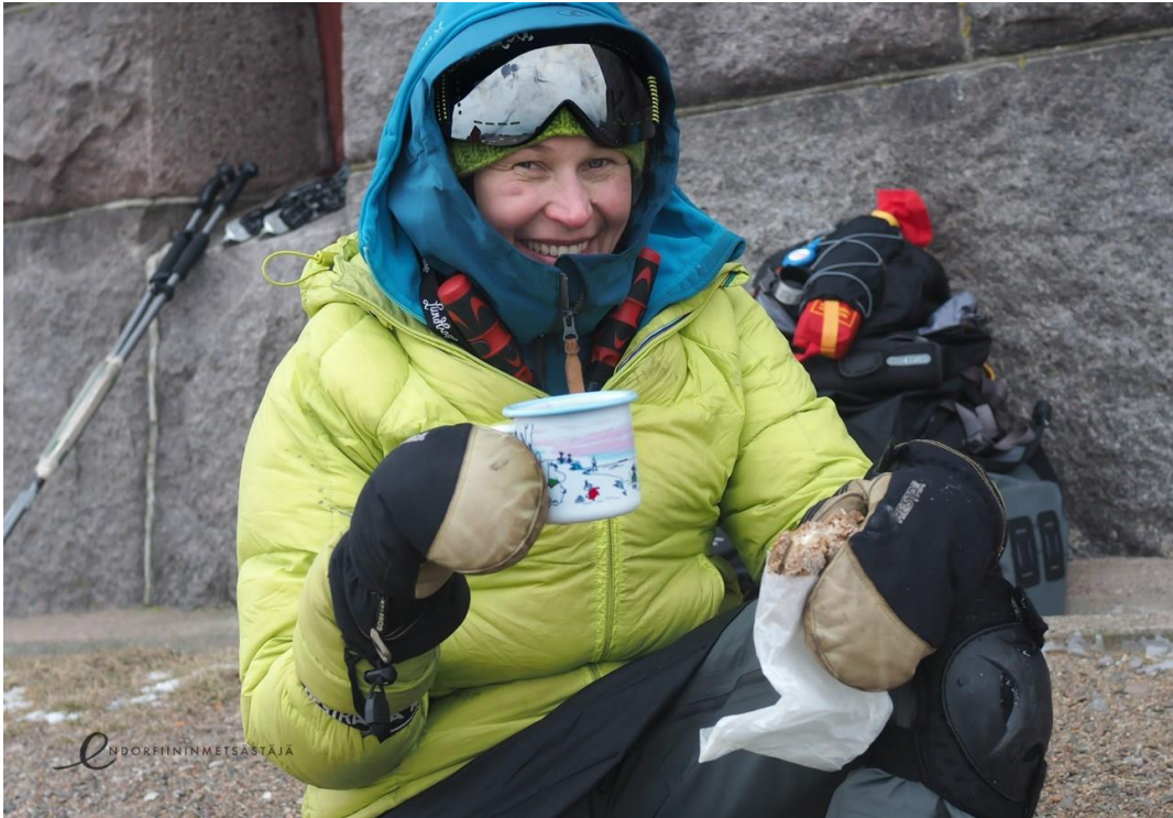
Kuva 2. Endorfiininmetsästäjä-blogin omakuva Bengtskärin seinustalla.