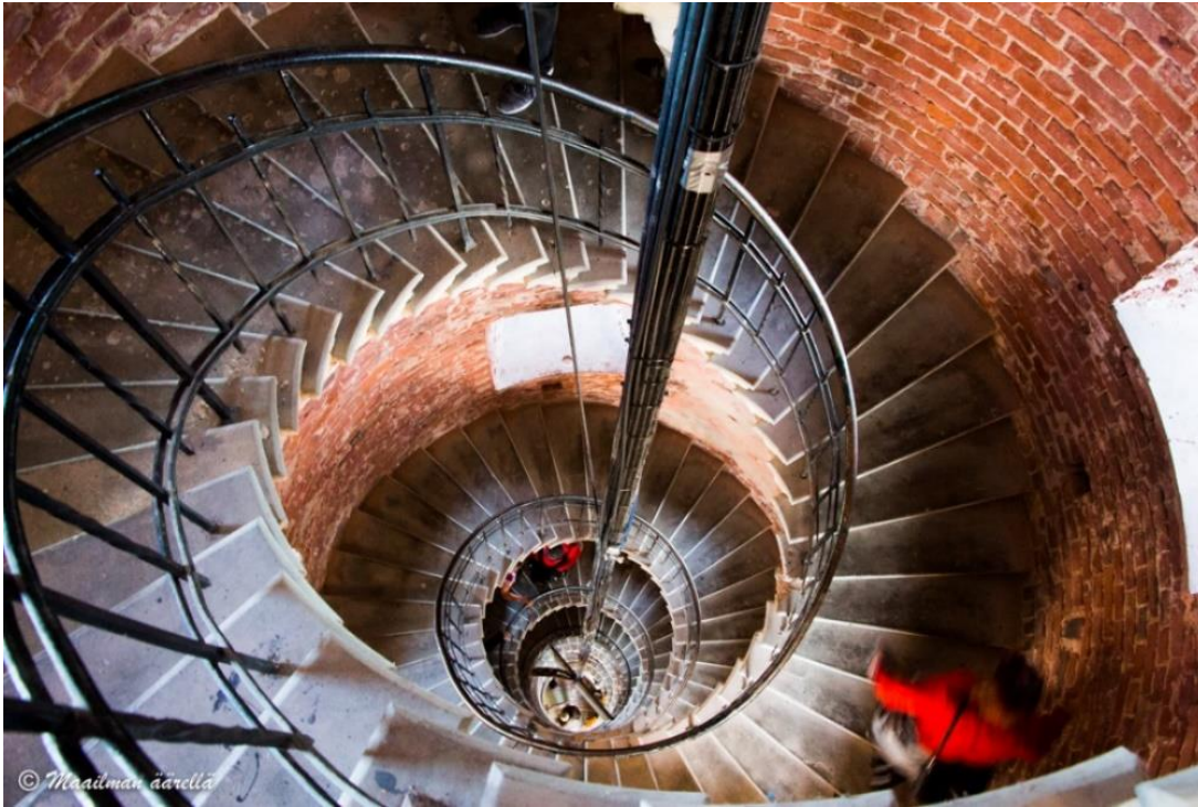
Kuva 6. Maailman äärellä -blogin kuva majakan tornin kierreportaista.