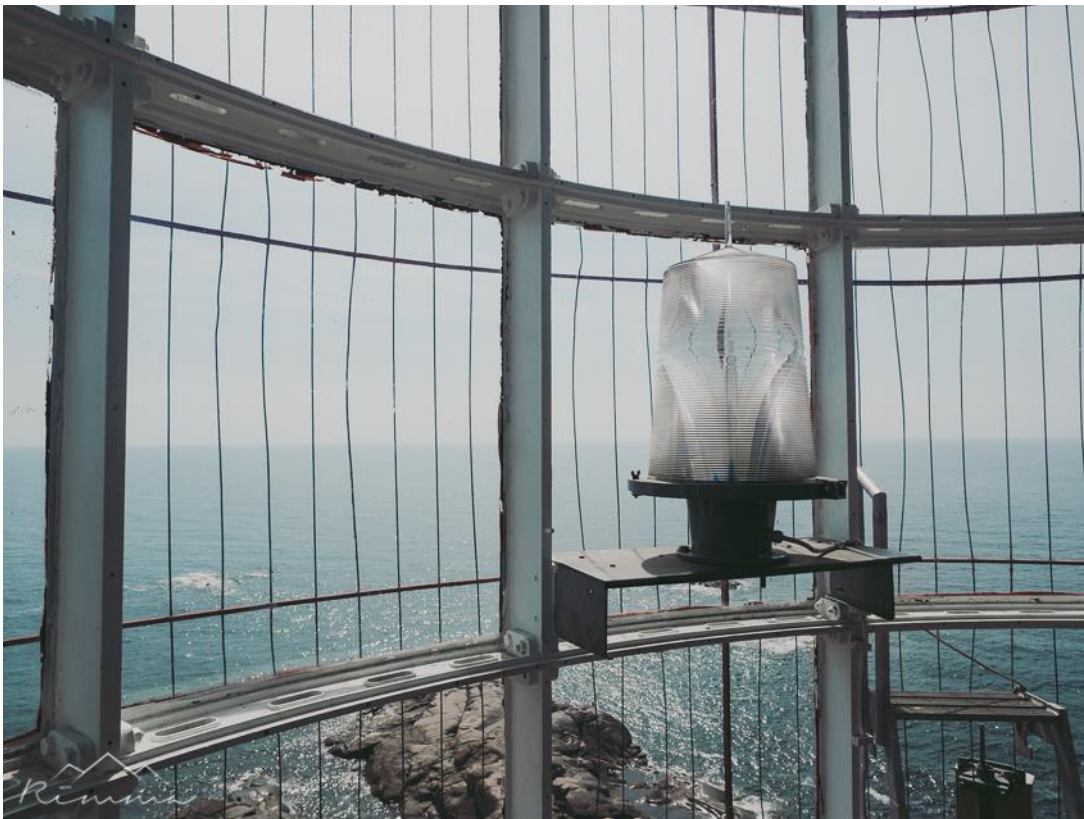
Kuva 7. Rimma+Laura-blogin kuva majakan linssistöstä.