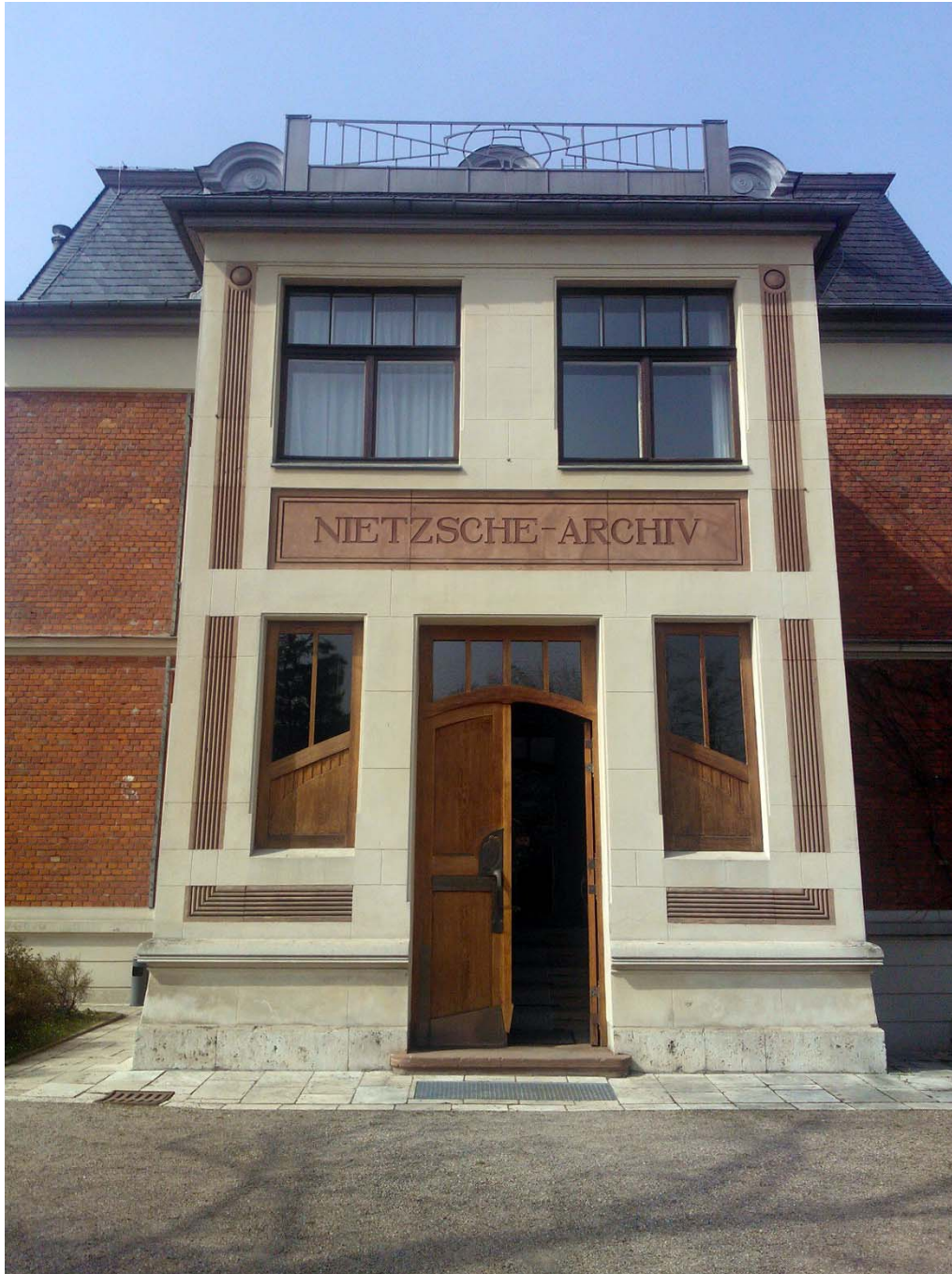
Kuva 1. Weimarin Nietzsche-arkiston pääsisäänkäynti.