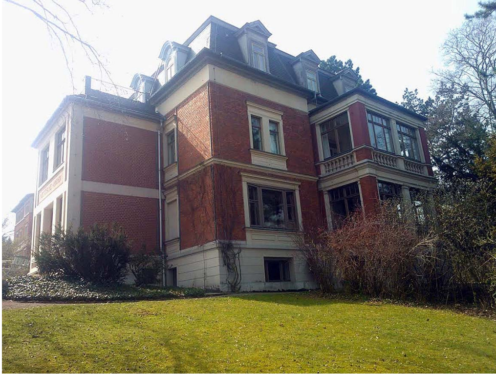
Kuva 8. Nietzsche-arkiston ulkosivu puutarhasta nähtynä vuonna 2014.