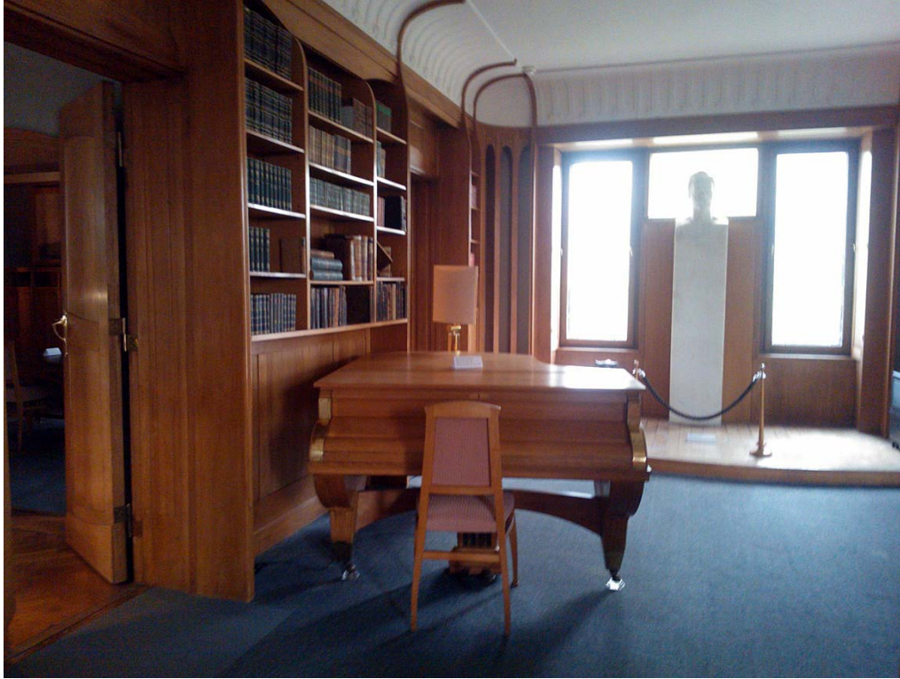
Kuva 3. Nietzsche-arkiston voimakasjalkainen flyygeli vuodelta 1903. Taustalla Max Klingerin 1905 veistämä Nietzschen marmorinen rintakuva.

Vuodesta 1923 lähtien Nietzsche-arkisto ajautui taloudellisiin vaikeuksiin hyperinflaation torjumiseksi käyttöön otetun Rentenmarkin vuoksi. Valuuttauudistus oli arkistolle katastrofi, joka ajoi vuonna 1908 perustetun Nietzsche-arkiston säätiön ( Stiftung Nietzsche-Archiv ) vararikkoon. Tästä edes arkisto kamppaili jatkuvien rahaongelmien kanssa, kunnes natsit alkoivat tarjota rahoitusta ja aloittivat samalla arkiston ”natsifioinnin”. Kansallissosialistien tarjoama ”apu” oli arkistolle viimeinen oljenkorsi kestävässä taloudellisessa tilanteessa. (Diethe 2003, 145–146.) Vuodesta 1928 lähtien Elisabeth Förster-Nietzsche hyväksyi Philip Reemtsman aluksi anonyymien vuotuisen 20 000 markan lahjoituksen. On epäselvää, kuinka hyvin kukaan ulkopuolinen oli tuossa vaiheessa selvillä lahjoittajan yhteyksistä Hermann Göringiin, sillä ne paljastuivat kokonaan vasta toisen maailmansodan jälkeen. En-