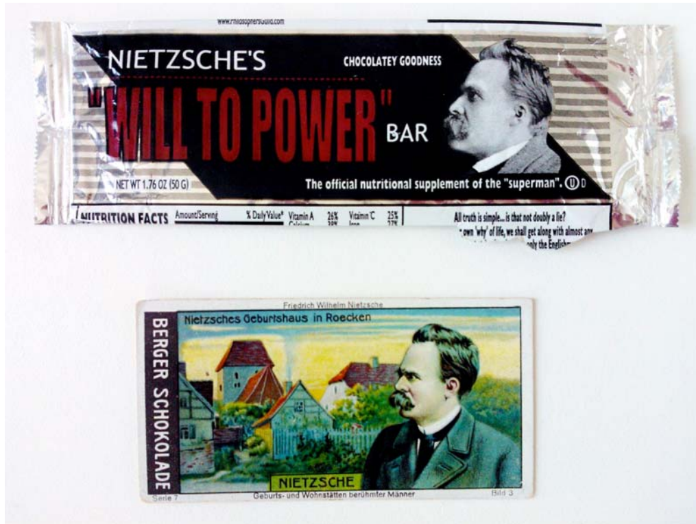
Kuva 6. Nietzsche-suklaapatukoita 1900-luvun alkupuoliskolta.