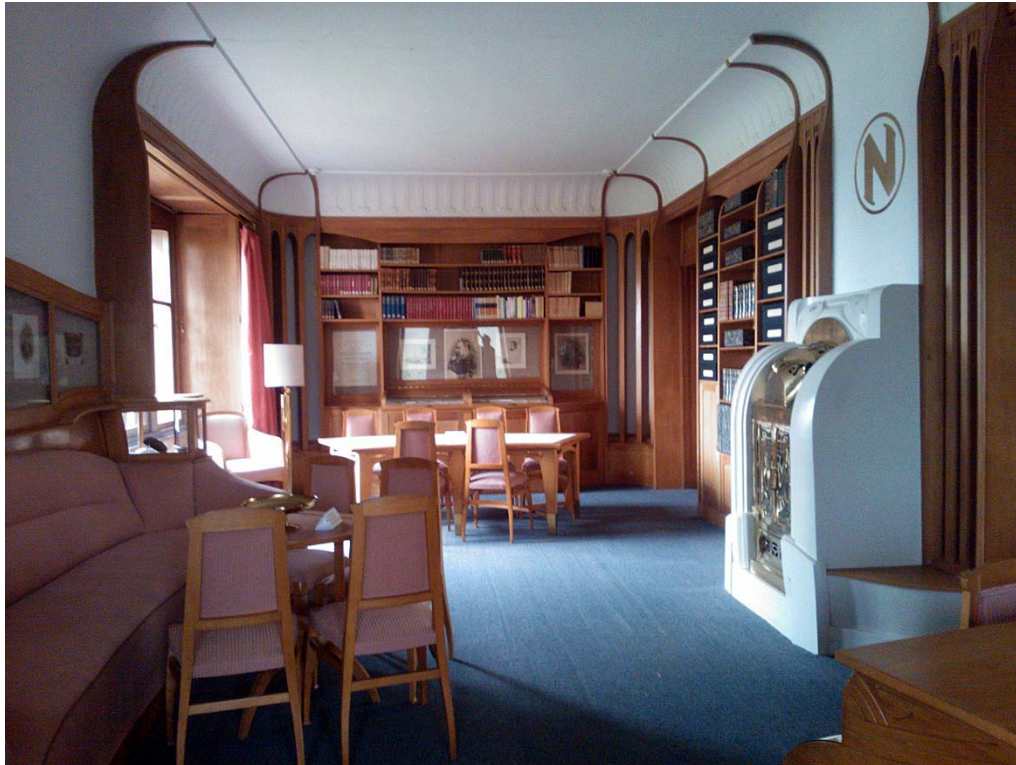
Kuva 4. Nietzsche-arkiston luentosalin kirjastoa, takka ja N-monogrammi. Alkuperäinen laualattia on peitetty kokolattiamatolla.

simmäisen maailmansodan jälkeen 1920-luvulla Nietzsche-arkisto siirtyi joka tapauksessa selvästi poliittisesti oikealle. (Diethe 2003, 148.) 1930-luvulla arkisto sai rahoitusta jo suoraan Adolf Hitleriltä (Diethe 2003, 151; Schad 2011, 140).