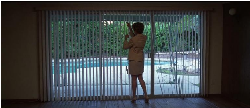
Kuva 6. Carolyn kuvataan sälekaihdinten takana "vankilassa". Lähde: American Beauty 1999 (0:12:51). Kuvakaappaus: Matilda Saarikoski