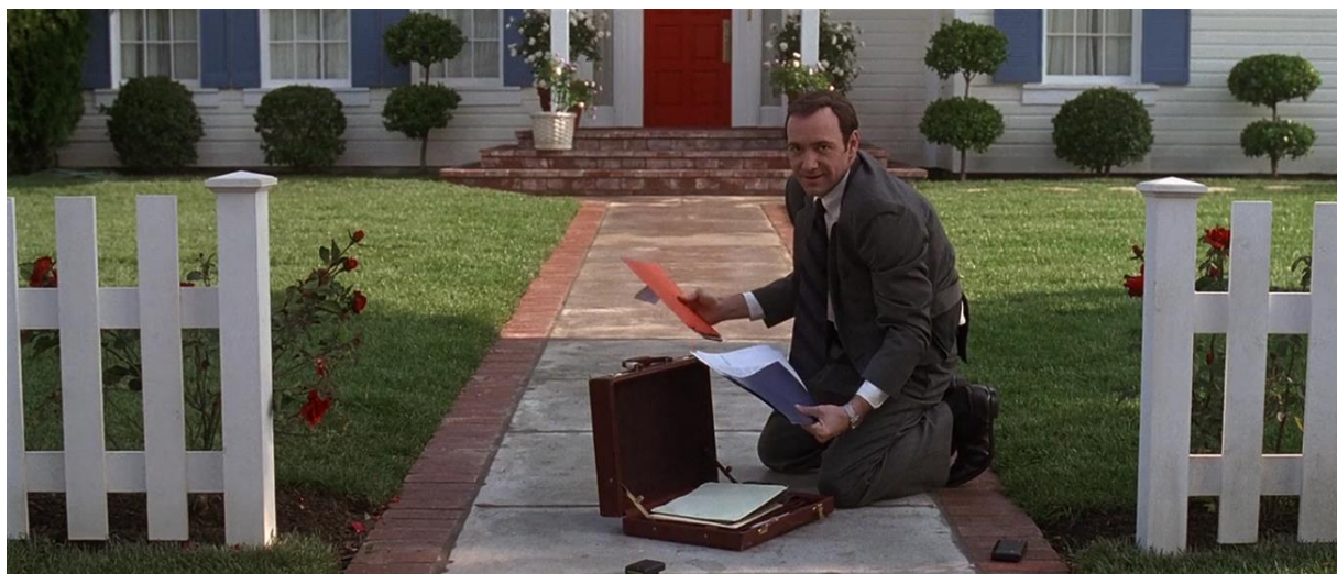
Kuva 9. Yhdysvaltain lipun värit näkyvät sekä Lesterin papereissa, että talossa tämän taustalla.

Alkuperäisessä kontekstissaan, Yhdysvaltojen lipussa, valkoisen on nähty merkitsevän puhtautta ja viattomuutta, punaisen urheutta ja kestävyyttä ja sinisen määrätietoisuutta ja oikeudenmukaisuutta. 21 American Beauty ssa lipun värit saavat kuitenkin uuden, satiirisen merkityksen. Bellantonini kuvaa värien tarkoitusta: ”Kolmen värin toistuminen piirtää alitajuisesti tietoisuutemme perinteisen amerikkalaisen perheen kammottavan arkkityypin: ulkoapäin katsottuna se näyttää hyvälle, mutta suljettujen (ja punaisten) ovien takana se kärsii ja rappeutuu.” 22 Värit siis ikään kuin alleviivaavat katsojalle, että tämä tässä on amerikkalainen perhe. Burnhamit sinipunavalkoisessa lähiömaailmassaan voisivat olla kuka tahansa perhe: he ovat kuin kaikkien keskiluokkaisten amerikkalaisten perheiden symboli. Värit viestivät, että tällainen on nykyajan amerikkalainen perhe: onneton ja materialistinen, potentiaalisesti jopa taipuvainen väkivaltaan.