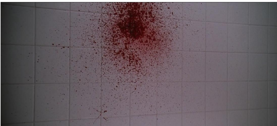
Kuva 4. ...ja seuraavassa hetkessä seinälle roiskahtaa verta. Veritahra valkoisella seinällä tuo mieleen ruusun.