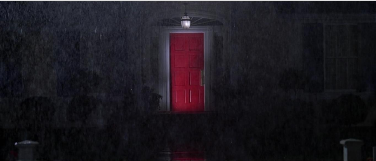
Kuva 10. Lesterin kuolinyönä punainen ovi hohkaa uhkaavasti. Lähde: American Beauty 1999 (1:49:00). Kuva-kaappaus: Matilda Saarikoski