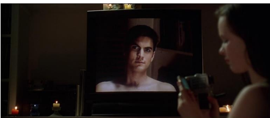
Kuva 8. Ricky vankina televisiossa. Lähde: American Beauty 1999 (1:18:50). Kuvakaappaus: Matilda Saarikoski