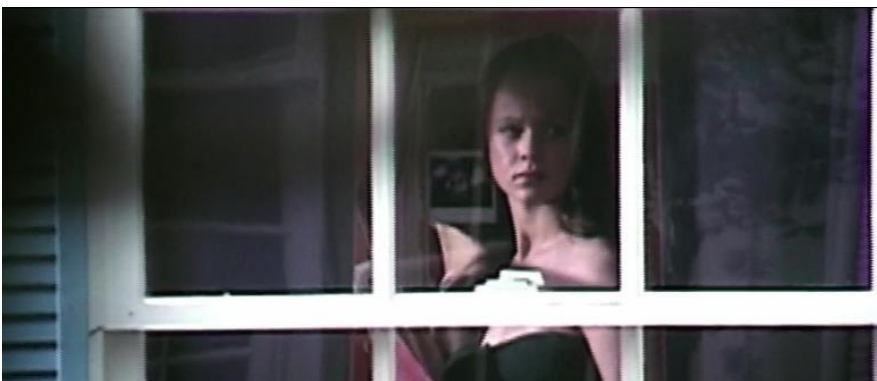
Kuva 7. Janen huoneen ikkuna muistuttaa vankisellin kaltereita.