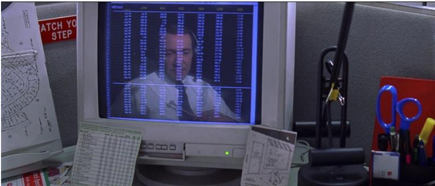
Kuva 5. Lester vankina tietokoneen ruudulla.

Smithin tapaan ehdottavan, että pakeneminen on mahdotonta, ja Lesterin vapautuminen on vain näennäistä. Todellinen vapautuminen American Beauty ssa tapahtuu vasta elokuvan lopussa, Lesterin hyväksyessä, että tämän on tyytyminen valitsemaansa elämään. Pakeneminen on turhaa ja mahdotonta.