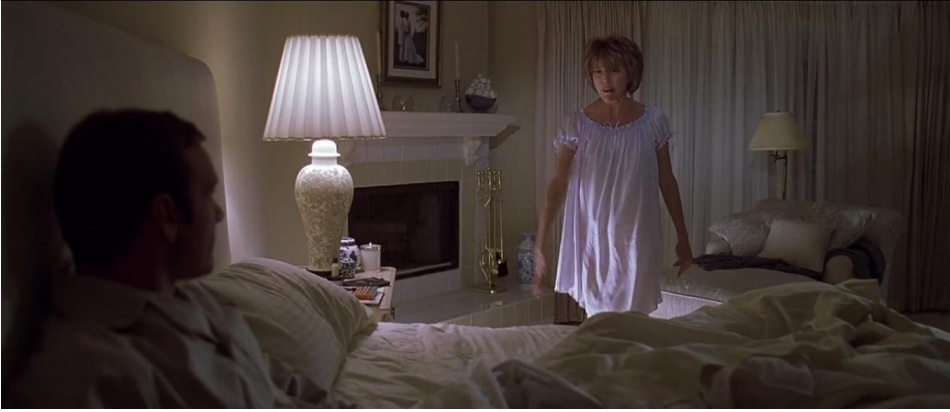
Kuva 14. Lesterin ja Carolynin makuuhuone on täysin väritön ja neutraali.