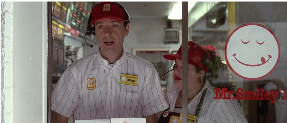
Kuva 12. Muuttunut, aktiivinen Lester punaisissa sävyissä uudella työpaikallaan. Lähde: American Beauty 1999 (1:27:33). Kuvakaappaus: Matilda Saarikoski