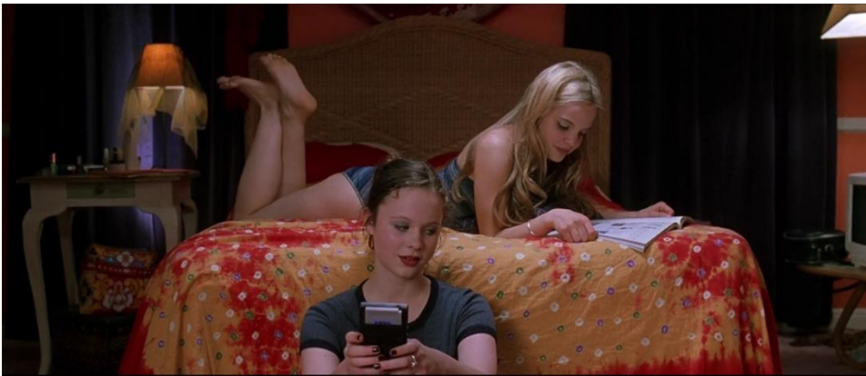
Kuva 15. Janen makuuhuone on täynnä värejä. Lähde: American Beauty 1999 (0:37:59) Kuva-kaappaus: Matilda Saarikoski