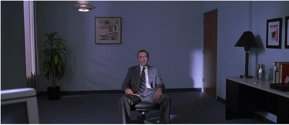
Kuva 11. Lester passiivisen siniharmaalla työpaikallaan.