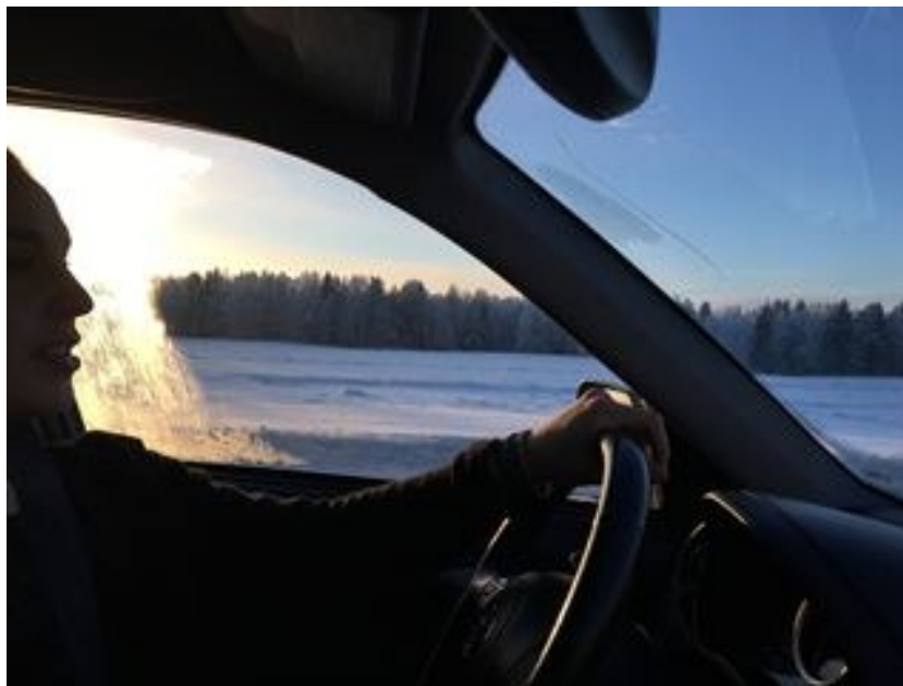
Roadtripillä Viitasaaren kautta kohti Oulua ja Muhosta.

Ihan mahtavaa oli se, että tämä opiskelija otti kutsuni vastaan, ja saapui maaliskuussa Jyväskylään. Pääsin esittelemään hänelle Jyväskylän yliopistoa ja kertomaan tarkemmin yliopistoelämästä. Päivän lopulla kävimme vierailemassa etnologian luennolla, jonka jälkeen pääsimme vielä huikeiden professoreidemme juttusille. Vierailijamme sai kysellä itse asiantuntijoilta opintoihin liittyvistä kysymyksistä. Päällimmäisenä jäi mukava fiilis siitä, että pystyin auttamaan nuorta ihmistä, joka kuumeisesti pohti tulevaa yhteishakua.