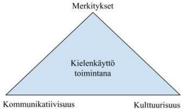
KUVIO 1: Diskurssianalyysin kolmio