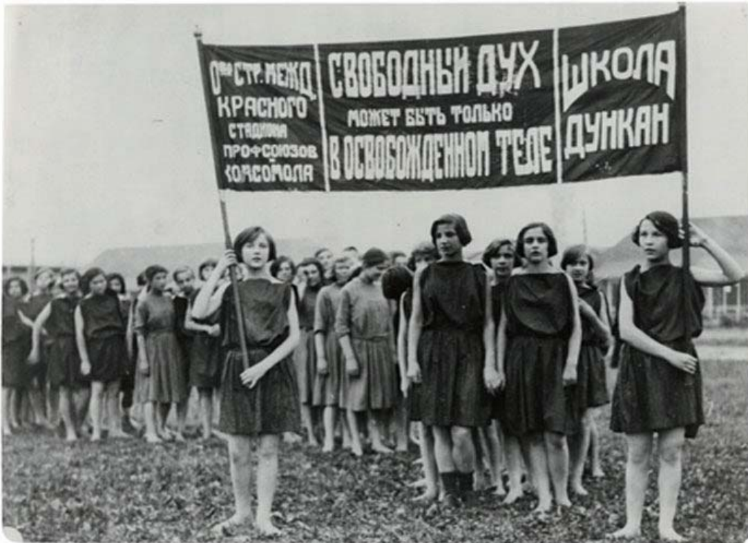
Isadora Duncanin tanssikoulun oppilaita Moskovassa 1924. Kyltissä: ”Vapaa henki voi olla olemassa vain vapaassa ruumissa”.