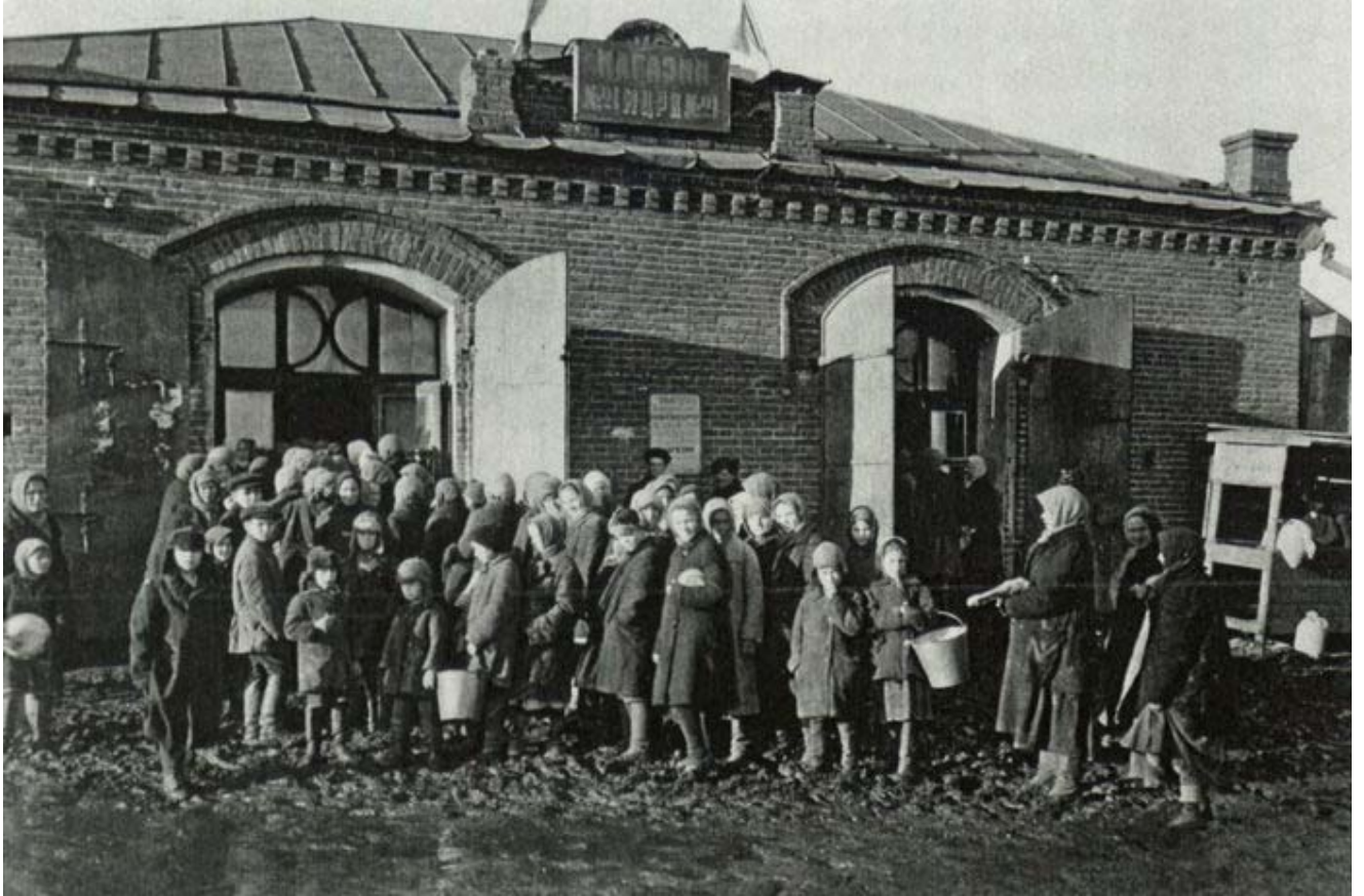
Naisia ja lapsia ruokajonossa Magnitogorskissa 1931.

näkemykset työpaikkademokratiasta kuitenkin menivät ristiin. Myös paikallinen väestö pyrki toisinaan sabotoimaan kolonian toimintaa. Suuri osa siirtokuntalaisista oli joka tapauksessa sitoutunut olemaan Kuzbasissa vähintään kahden vuoden ajan.