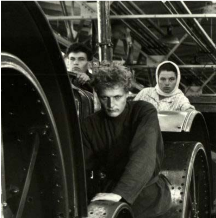
Yhdysvalloista tulleen avun turvin rakennettu traktoritehdas Tractorstroi 1930.

Kuzbas olikin Neuvostoliiton uuden talouspolitiikan kauden merkittävin ulkomaalaisten toteuttama hanke.