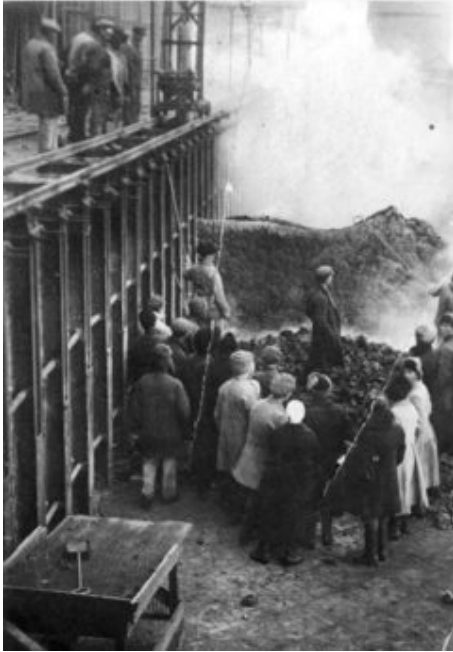
Tuotantoa Kuzbasissa.