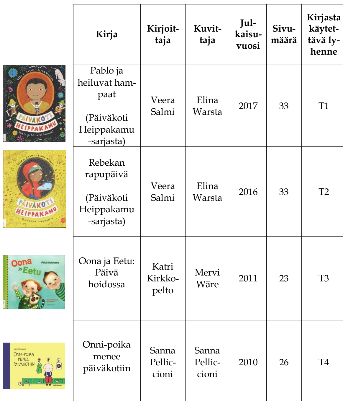
TAULUKKO 1. Tutkimusaineistona olevien kuvakirjojen tiedot.

Laadullisessa tutkimuksessa tutkijalla on mahdollisuus käyttää valmiita aineistoja (Eskola & Suoranta 2014, 118–119), joita myös minä hyödynsin kuvakirjojen muodossa. Tutkimukseni tarkoituksena on selvittää, miten lasten liikkuminen