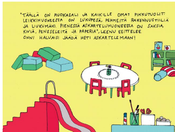
KUVA 12. Leikkihuoneessa on liukumäki ja rakentelutiiliä liikunnallisiin sisäleikkeihin (T2).