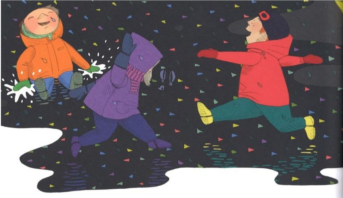
KUVA 1. Tyttö ja poika juoksevat vesilätäkössä (T2).

Sisätiloissa juoksemisesta on kirjoissa kaksi mainintaa. Toisessa kohdassa poika juoksee eteisestä keittiöön (siirtymä) ja toinen maininta kuvaa kahden pojan leikkiä (T1). Leikkitilanteessa kaksoset Aamos ja Aatos ampaisevat lepohuoneesta toisten lasten joukkoon ja juoksevat ”yhä kovempaa” kaarrellen ja kierrellen kuin helikopterit. Juoksemista ei ilmeisesti sallita sisätiloissa, sillä Ulla-kasvattaja seisoo kädet levällään ja sanoo: ”Ei saa juosta.” (Kuva 2.)