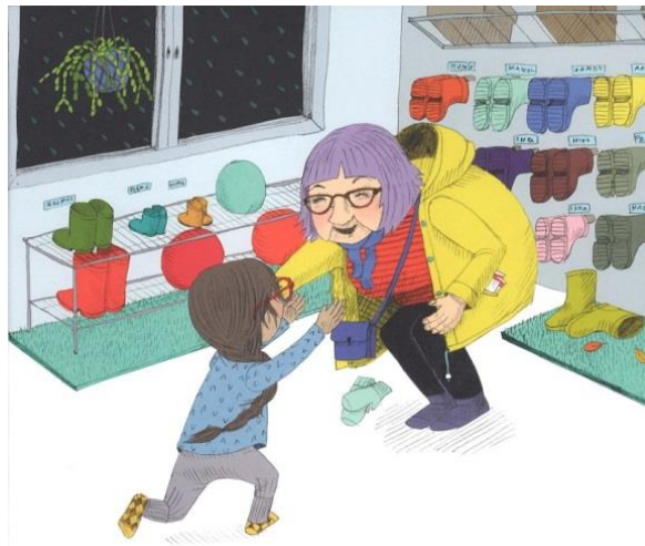
KUVA 13. Eteisessä on palloja lasten leikkejä varten (T4).

Kuvakirjoissa on kuvattu sekä kasvattajien ohjaamaa liikkumista että kasvattajien roolia lasten liikkumisen tukijoina ja edistäjinä. Kasvattajat ohjaavat liikuntatuokioita, joiden sisältöä ei kuitenkaan ole erityisesti avattu. Kasvattajat edistävät lasten liikkumista hyväksyvällä asenteellaan liikkumista kohtaan (esim. lapsia ei kielletä liikkumasta aamupiirissä), omalla esimerkillään (esim. kasvattajat keinuvat ulkona lasten kanssa) ja liikuntavälineiden tarjoamisella lasten käyttöön (esim. ulkona leikkittelineet ja keinut, sisällä pallot ja liukumäki).