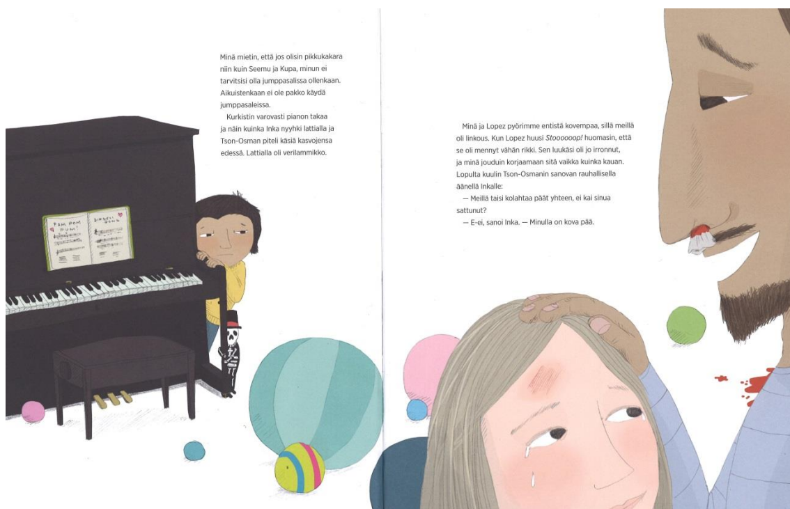
KUVA 9. Kasvattaja on mukana liikuntatuokiossa, jossa on leikitty palloilla (T1).

Seuraavalta aukeamalta selviää, että Tson-Osman-kasvattajan ja yhden lapsen päät ovat kolahtaneet yhteen ja Tson-Osmanin nenästä tulee verta, ja tästä syystä kaikki ovat lopettaneet liikkumisen (KUVA 9). Vahingosta päätellen jumpparadalla on ollut kovaa touhuamista ja kasvattaja on ollut mukana liikkumassa lasten kanssa. Tson-Osman on piirretty aukeaman oikeaan laitaan isona; hänen hahmonsa täyttää koko oikeanpuoleisen sivun reunan. Kasvattajan roolia ja mukana oloa liikuntatuokiolla ei ole ainakaan haluttu piilottaa. Pianon nuottitelineellä on avoimena musiikkikirja, jossa näkyvät kappaleet Pom pom pum! ja Dingeli dong . Kenties jumppatuokioon on sisällytetty musiikkiliikuntaa, jolloin lapset ovat saattaneet Pom pom pum! -kappaleen tahtiin leikkiä palloilla ja pomputella niitä, sillä lattialla lojuu siellä täällä pieniä ja isoja palloja. (T1.) Liikuntatuokiot voidaankin integroida esimerkiksi osaksi musiikkia (Pönkkö & Sääkslahti 2017, 142).