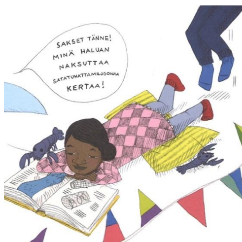
KUVA 3. Lapsi hyppimässä (T2).