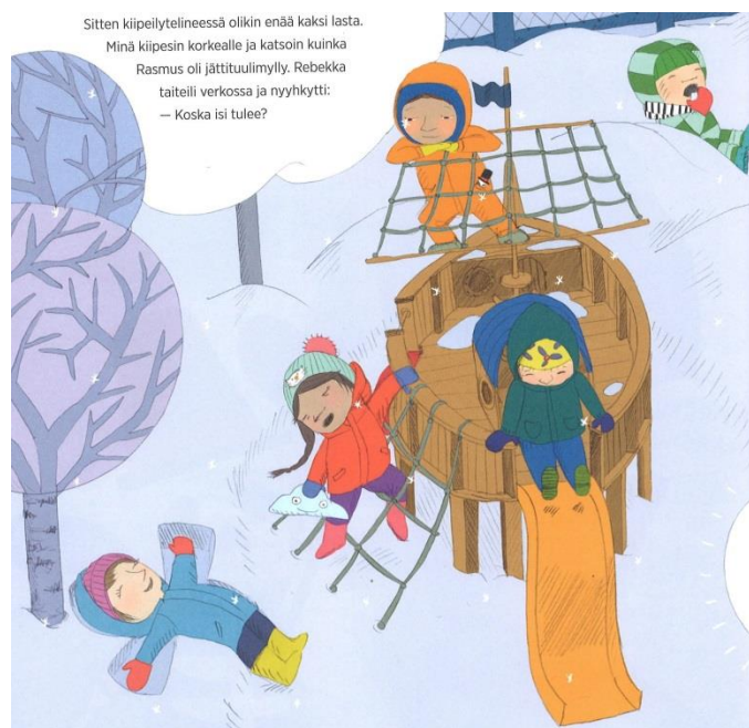
KUVA 8. Kiipeilytelineessä voi touhuta talvellakin (T1).

Erilaiset liikkumisvälineet ja -rakennelmat innostavat lapsia liikkumaan ulkona. Albert-poika keinuu tyytyväisen näköisenä pandajousikeinussa: hän pitelee kiinni vasemmalla kädellä ja heiluttaa oikealla kädellä. Vauhtiviivat Albertin molemmilla puolin kuvastavat keinumisliikettä. (T2.) Kiipeilytelineessä voi liikkua sekä vauhdikkaasti tempuillen että kevyesti liikkuen (KUVA 8). Päiväkodin pihassa olevassa laivakiipeilytelineessä on liukumäki, jota eräs lapsi on juuri menossa laskemaan. Purjeena toimivassa verkossa on mukava kiipeillä ja seurata pihan tapahtumia. Muuan poika on kiivennyt leikkilaivan "purjeverkkoon" ja nojailee siellä rennon oloisesti verkkoon käsivarret leuan alla ja jalat tukevasti haara-asennossa. Kiipeilytelineen vieressä lumessa makaa tyttö, joka tekee lumienkeliä ja hymyilee iloisen näköisenä. (T1)