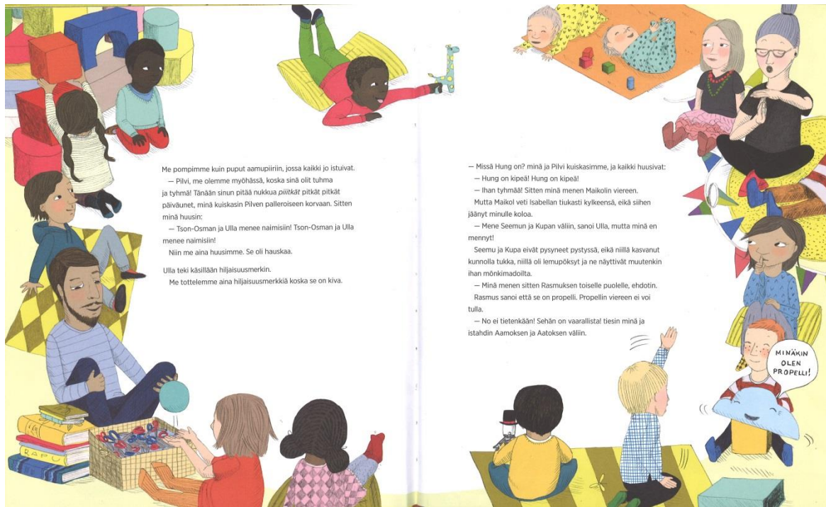
KUVA 6. Lapset liikkuvat aamupiirissä: yrittävät ryömiä, leikkivät propellia, heittelevät palloa, rakentavat palikoista tornia (T2).