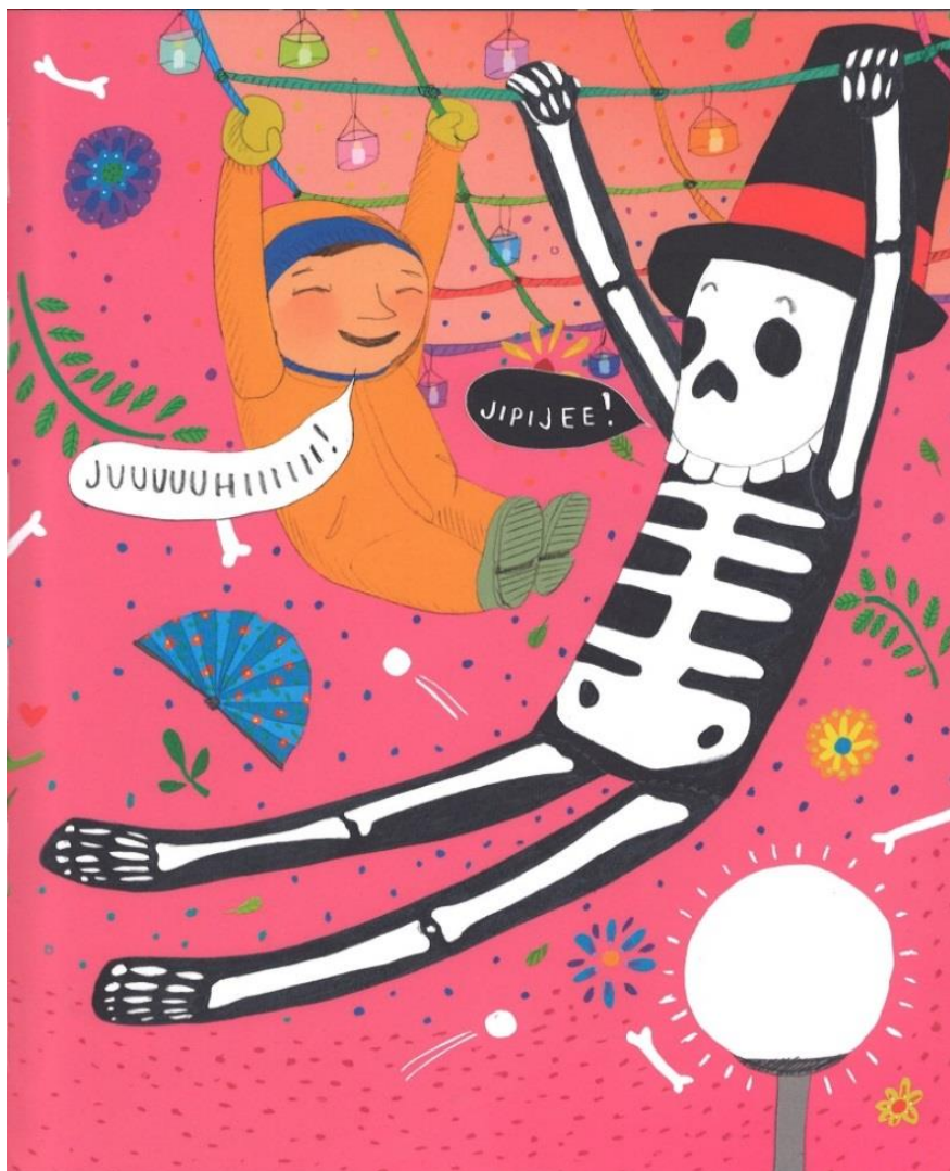
KUVA 5. Pablo roikkuu kiipeilytelineessä Lopez-leikkiluurankonsa kanssa (T1).

Reippaasti kuormittavaa liikkumista kuvataan kirjoissa monipuolisesti ja suhteellisen paljon: esimerkiksi hyppimisen, kieriskelyn, pyörimisen, tanssimisen ja rapukävelyn lisäksi monet leikit sisältävät reipasta liikkumista. Kirjoissa lapset liikkuvat reippaasti kuormittavasti yhdessä kaverin/kavereiden tai sisaruksen kanssa, mutta myös itsekseen ja oman lelunsa kanssa.