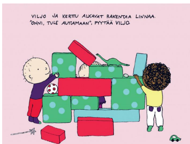
KUVA 7. Lapset rakentavat linnaa suurista rakentelupalikoista (T4).

Lasten sisäleikit ovat itsessään kevyesti kuormittavaa liikkumista ja niitä kuvataan sekä tekstissä että kuvissa runsaasti. Viljo, Kerttu ja Onni rakentavat linnaa suurista rakentelutiilistä päiväkodin leikkihuoneessa (KUVA 7). Onni ja Viljo seisovat varpaillaan ja kurottavat ylöspäin, jotta saavat tiilet nostettua korkealle linnan muurille, sillä linna on jo lapsia korkeampi. Linnan rakentaminen vaatii esimerkiksi kumartelua, palikoiden nostelua, kurottelua ylöspäin, varpaillaan seisomista (tasapainoilu) ja palikoiden asettelua paikoilleen. (T4.) Myöhemmin kirjassa Onni, Kerttu ja Viljo pukeutuvat roolivaatteisiin ja leikkivät rakentamassaan palikkalinnassa (T4).