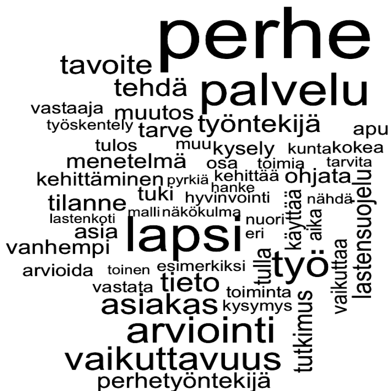
Kuvio 3. Esimerkki sanapilvestä: perhetyöhön liittyvät sanat (aihe 6)

Aihealueet 2 ja 6 liittyvät lastensuojeluun ja perhetyöhön. Aiheessa 6 on esillä myös arviointiin liittyviä sanoja. Päädyimme kutsumaan aihealuetta 2 nimellä ”lastensuojelu” ja aihealuetta 6 nimellä ”perhetyö” . Seuraavassa aihealuetta 6 kuvaava sanapilvi: