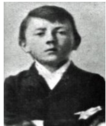
Adolf Hitler koulukuvassa