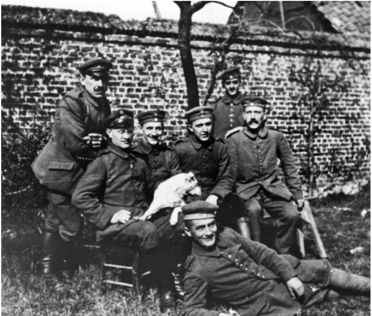
Adolf Hitler ensimmäisen maailmansodan aikana (istumassa oikealla)