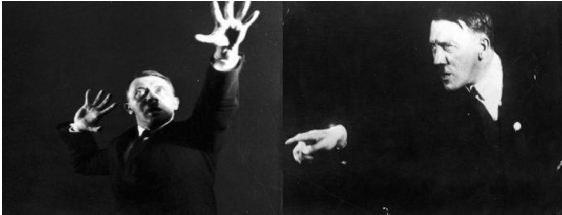
Hitler harjoittelemassa puhettaan peilin edessä 1925.