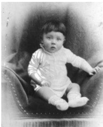
Adolf Hitler lapsuudenkuvassa