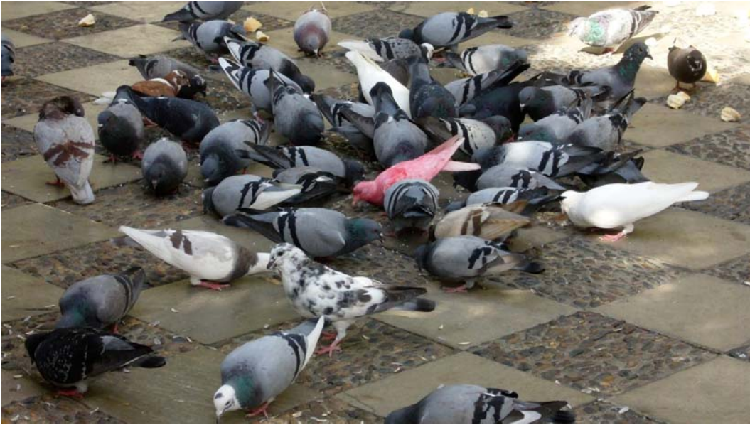
Kuva: Helmi Räisänen