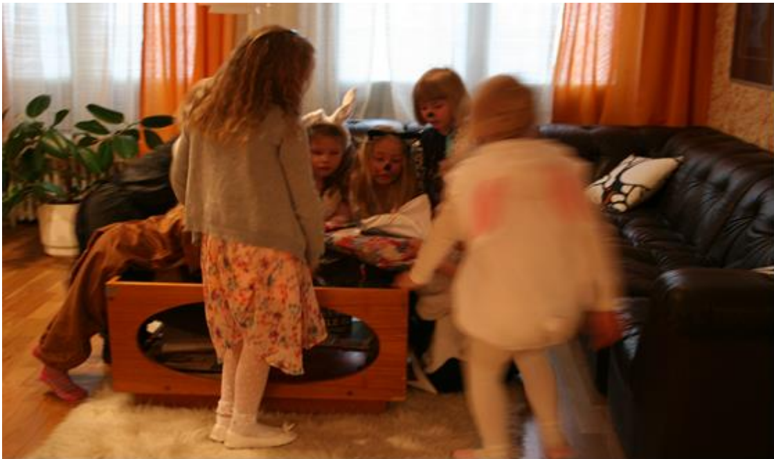
Kuva 3. Lahjojen jako.

Lapset arvostavat syntymäpäivien perinteisiä rituaaleja, mikä selviää Harlekiinin kekereiden osallistujia kuunnellessa ja seuratessa. Lapset odottavat tuttuihin syntymäpäivärituaaleihin kuuluviksi mieltämiään asioita innokkaasti; herkuttelua, lahjojen avaamista sekä perinteisiä leikkejä, kuten ongintaa tai hippaa. Tämä tulee esiin lasten ilmaisemista toiveista sekä ennen kekereitä että niiden aikana. Usein heti saavuttuaan museoon lapset tiedustelevat, milloin on kakun leikkaamisen aika tai milloin syntymäpäiväsankari avaa lahjat. Olen kuullut, kuinka lapset arvuuttelevat etukäteen keskenään, mikä lahja on missäkin paketissa tai onko joku kenties tuonut sankarille lahjaksi lasten ihaileman suosikkilelun.