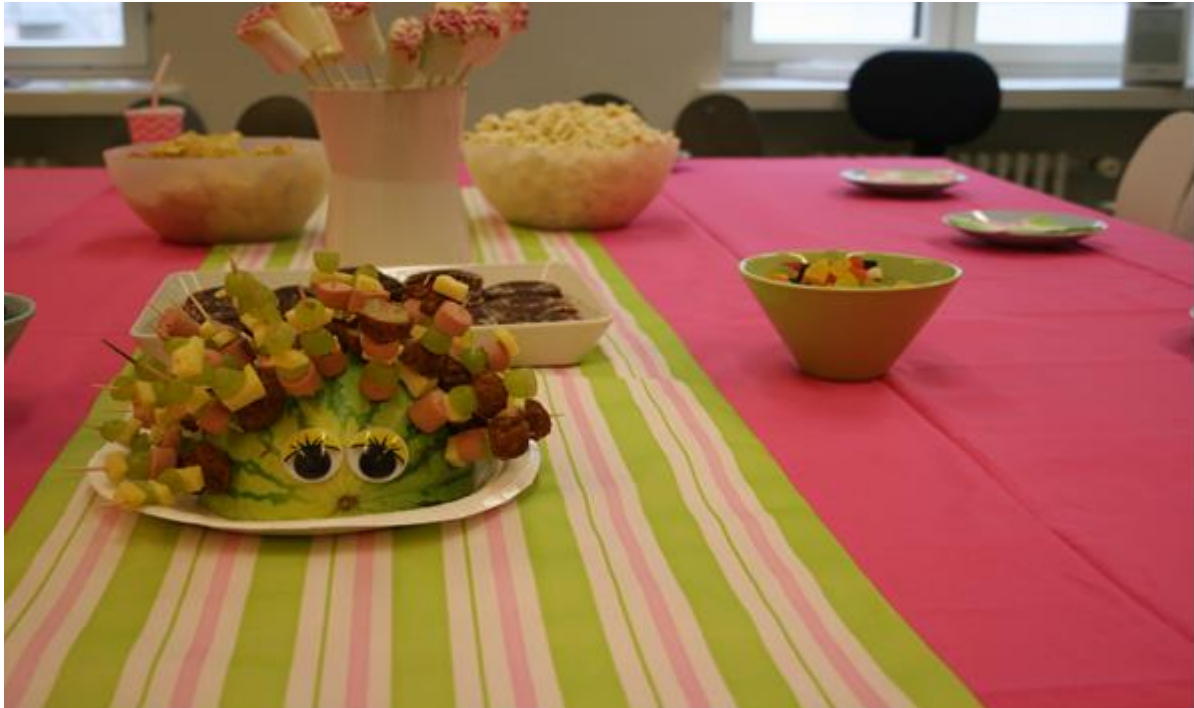
Kuva 9. Tarjoilupöytä katettuna.

lasten askarteluja. Kodinomaisuutta luo myös tilan yhteydessä oleva keittiö, jossa on värikkäitä yksityiskohtia. Taika-tilassa näyttelykierroksen aikana mahdollisesti lasten kokema jännittyneisyys ja arkuus useimmiten viimeistään hellittävät. Tilan olemuksella on huomattava merkitys, mutta myös koko kekkereiden toiminnan organisoinnin tavoilla esimerkiksi puhutteluilla, tehtävänannoilla ja leikeillä voidaan kokemukseni mukaan vaikuttaa ryhmän sisäiseen tunnelmaan.