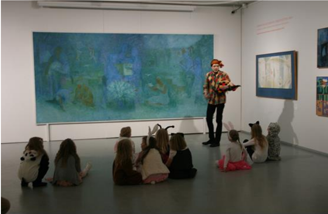
Kuva 4. Museon näyttelykierroksella.

Seurattuani toisten ohjaajien kekkereitä huomaan, että näyttelykierroksen aikana ohjaaja saattaa kertoa taiteesta lapsille tai taidenäyttely saatetaan käsitellä melko nopeasti kenties yhdellä lapsille annetulla tehtävällä tai lukuisilla erilaisilla toimintaosioilla. Tutustuminen näyttelyyn siis vaihtelee hyvin suuresti ohjaajasta toiseen. Mielestäni taidenäyttely itsessään antaa usein inspiraatiota siihen, millä tavoin taiteeseen tutustutaan. Ohjaajan näkökulmasta vaihtelevuus on toisaalta hyvä asia, koska saa käyttää omaa luovuuttaan ja vapautta, toisaalta se vaatii ohjaajalta joka kerta huolellista suunnittelua ja paljon aikaa. Menetelminä tutustua taiteeseen on käytetty esimerkiksi teos-suunnistusta tai jonkinlaista eläytymistehtävää. Pohdin, voisiko ohjaajien avuksi koota erilaisten menetelmien listaa tai ylipäätään ideapankkia.