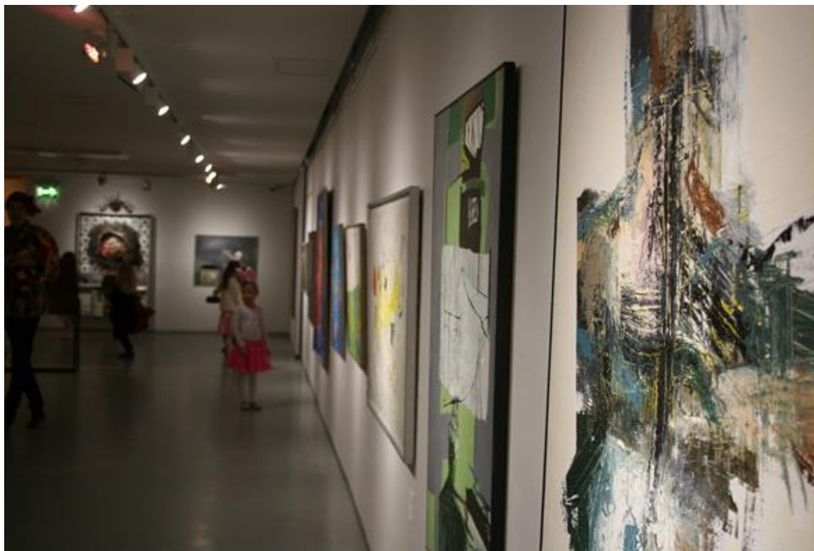
Kuva 8. Näyttelytilassa.

Kekkereihin osallistuville lapsille on tyypillistä, että he ottavat tilaisuuden tullen kontaktia toisiinsa pyrkien toimimaan yhteisöllisesti. Kontakti voi havaintojeni mukaan muodostua katseista, fyysisestä kontaktista, juttelusta, naurusta, leikkimisestä tai tilallisesta sijoittumisesta. Aikuisen johdatellessa toimintaa, tulisikin muistaa tukea näitä kohtaamisia, ei yrittää karsia niitä. Tässä yhteydessä Stolp (2011, 72) puhuu vastarinnan ja vastakulttuurin käsitteistä. Stolpin mukaan lapset keksivät tapoja vastustaa auktoriteetteja, esimerkiksi elein ja viestein, joita aikuinen ei välttämättä huomaa ja joista ei näin ollen voi rangaista. Pääjoki (2007, 292) toteaaakin, että lasten kulttuurinen vastarinta saattaa jäädä aikuisilta huomaamatta tai se saatetaan leimata jopa huonoksi käytökseksi. Kokemukseni mukaan näitä lasten keskisiä hetkiä syntyy spontaanisti pitkin kekkeritapahtumaa, mutta ne myös toisinaan hiipua aikuisten puuttuessa toimintaan. Voi olla, että kekkeillä kontaktin ottaminen toisiin saatetaan tulkita häiriköinniksi joskus siksi, että museoympäristön tapanormisto perustuu hillittyyn käytösnormiin. Esimerkiksi lasten ulkoleikkien tavoille on vierasta tällainen hillitty ja hiljainen käytös. Ehkäpä museoympäristöön voitaisiin rohkeasti soveltaa osin tällaista reippaampaa ja spontaanimpaa olemisen tapaa.