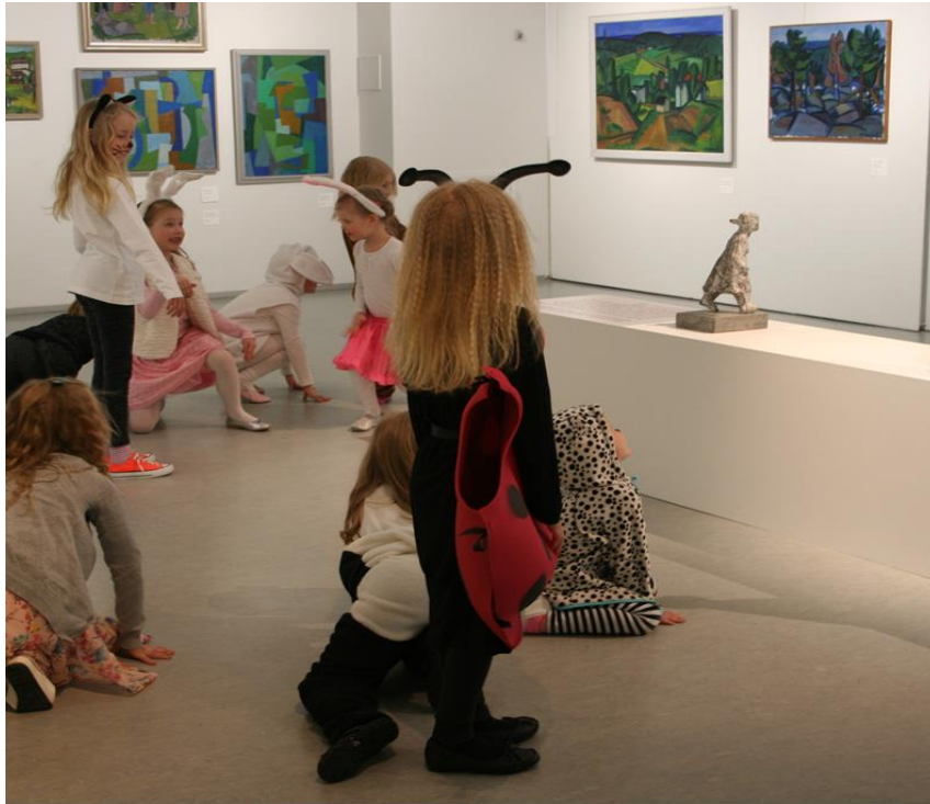
Kuva 5. Näyttelykierroksen toiminnallinen osuus.

Toiminnallinen osuus on useimmiten vapauttanut syntymäpäivien tunnelmaa ja ollut lapsille mieleinen. Lapset ovat yleensä liikkuneet taitavasti näyttelytilassa ja ottaneet tilassa olevat teokset huomioon. Joskus joku lapsista on halunnut koskettaa teoksia, jolloin ohjaaja on selittänyt, miksi teoksiin ei voi koskea. Ohjaamillani kekkereillä muutama teokseen on liittynyt mahdollisuus koskettaa tai toimia itse aktiivisesti teoksen antaman materiaalin, esimerkiksi vaatteiden kanssa.