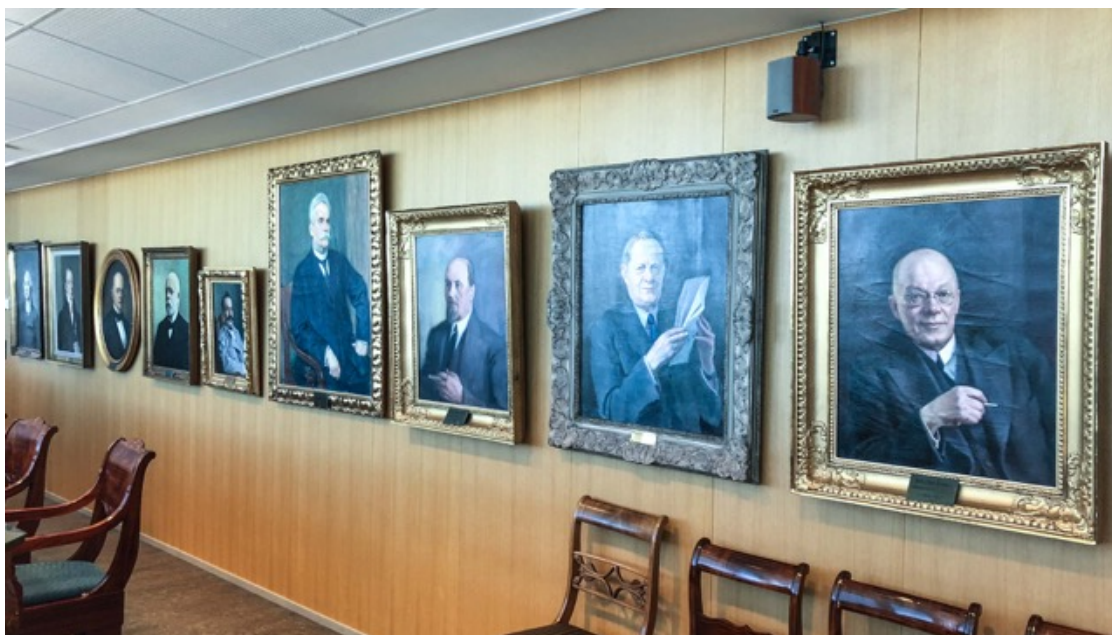
Kuva 9. Neuvotteluhuoneeseen sijoitettuja THL:n edeltäneiden laitosten pääjohtajien muotokuvia. Teokset ovat THL:n omistuksessa.

Henkilöstön taideharrastamiseen liittyen taideryhmällä on tarkoitus toteuttaa taidekasvatuksellista työtä aluksi ideoiden, miten henkilökuntaa voitaisiin aktivoida taiteen pariin. Tätä taiteen harrastamista tukevia toimenpiteitä taideryhmä ei ole vielä resurssien puolesta pystynyt toteuttamaan. Taideryhmällä olisi haluja saada henkilöstöä verkostoitumaan taideasian suhteen, esim. järjestämällä taideaiheisia kahvihetkiä tai järjestää erilaista taideaiheista toimintaa ruokkimaan henkilöstön luovuutta. Ajatuksena on järjestää henkilöstölle harrastusryhmiä, samaan tapaan kuin THL:ssä järjestetään nykyisin ryhmiä erilaisiin urheilulajeihin. 205 Keskusteluissa on myös ollut, että henkilöstön itse tekemää taidetta voisi olla esillä THL:n tiloissa 206 . THL:n taideryhmä on hyvä esimerkki siitä, kuinka valtion organisaatioiden omat taideryhmät voisivat olla se taho, mikä tekisi sitä taidekasvatuksellista työtä, mihin valtion taideos- toimikunnalla ei ole resursseja. Tämä työ vaatii toki resursseja kyseisten organisaatioiden henkilöstöltä. THL:n osalta halutaan tähän työhön panostaa ja henkilöstöä taide- työssä tukea. THL:ssä taide koetaan osaksi henkilöstön hyvinvointia, viihtyisyyttä ja yhteisöllisyyttä. Tähän asti taideryhmän työskentely on pääosin liittynyt jo THL:n