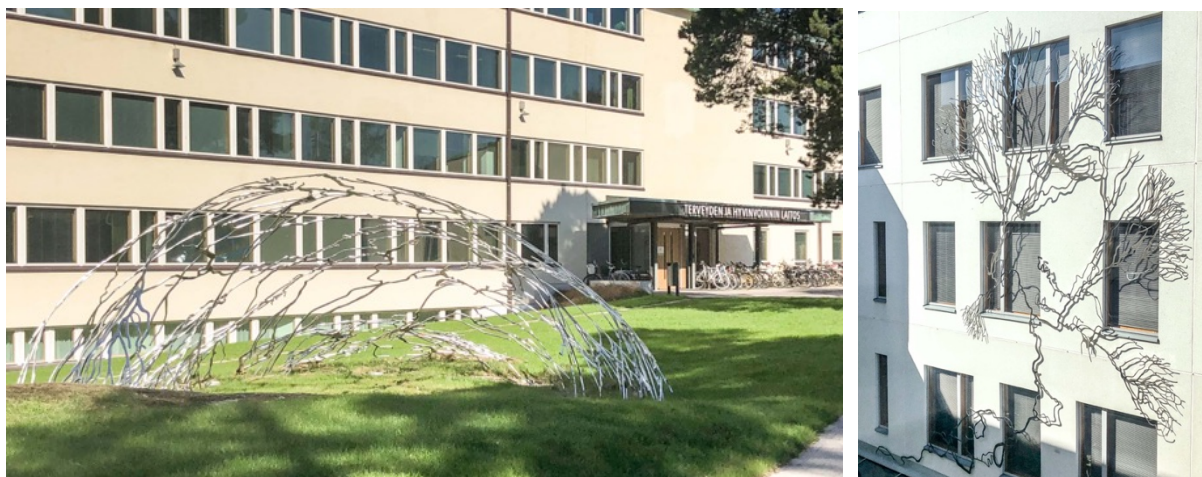
Kuvat 2 ja 3. Mycelium-teoksen kaksi ulkopuolista osaa piha-alueella ja J-rakennuksen julkisivussa.