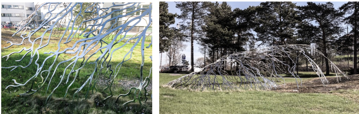
Kuvat 4 ja 5. Mycelium-teoksen piha-alueen osa, yksityiskohta ja kuvattuna Mannerheimintielle päin.