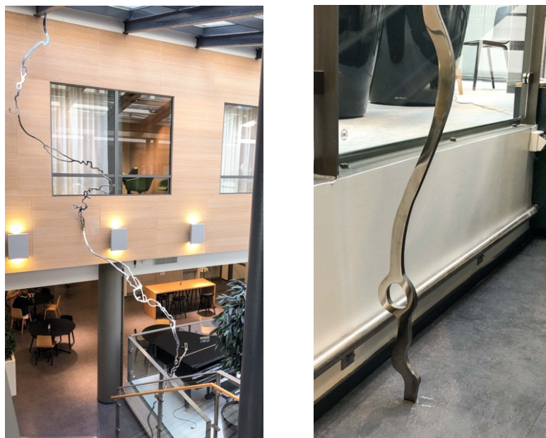
Kuvat 6 ja 7. Mycelium-teoksen sisäosa kokonaisuudessaan ja yksityiskohta teoksesta. Kuvat: Mika Järvinen.

teokseen ja suostui suunnitteluvaiheen aikana tilaamaan lisäosan taiteilijalta erillistilauksena 180 .