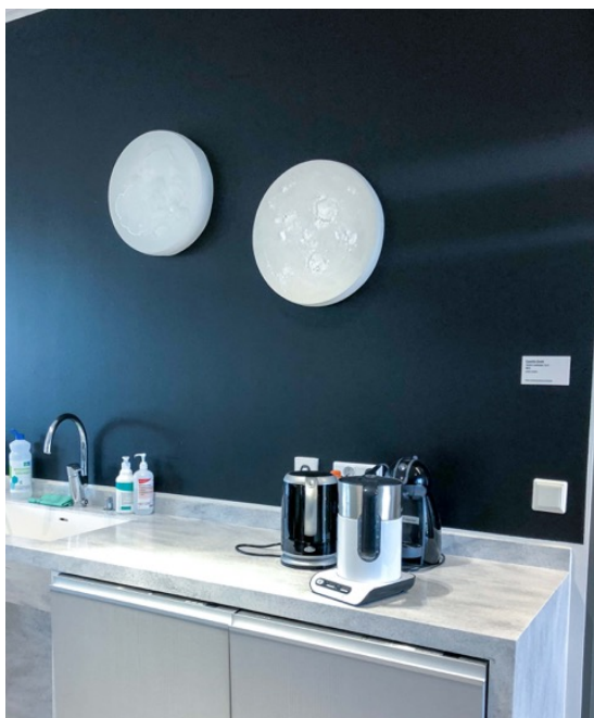
Kuva 11. Camilla Groth: Tactile Landscape 1 ja 2 (posliinireliefi, 2012). Teokset sijoitettu taikotilan liitumalilla maalatulle keittiökalusteseinälle.