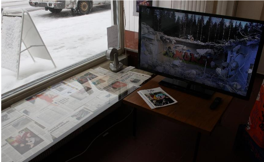
Ikkunalaudalla lehtiartikkeleita, televisiossa kuvasarja ja pöydällä kaksi graffitilehteä.