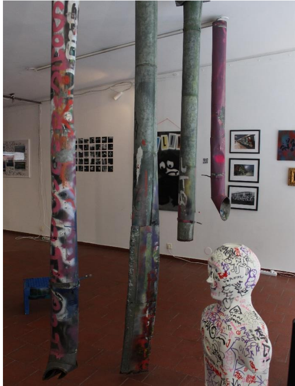
Seinällä valokuvia ja Felinx- teos. Keskellä maalatut rännit ja olutkori. Kuvan etualalla vieraskirjana toiminut hengenvastusnukke.