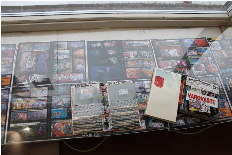
Kuvia graffiteista eri pinnoilla ja kotialbumeita.

Historiaa löytyi melkein kaikista aiemmin mainitsemistani töistä joko tyylin tai työn tekemisajankohdan puitteissa, mutta dokumentoidussa muodossa se oli painottunut ikkunalaudalle ja sen läheisyyteen aseteltuihin graffitilehtiin, kotialbumeihin ja lehtiartikkeleihin. Lisäksi tabletilla pyöri videoita parista menneestä katutaidetapahtumasta ja televisiossa pitkä kuvasarja tehdyistä maalauksista. Kuvat paljastivat laajan kirjon eri tekijöitä. Lisäksi graffiteja ja katutaidetta on Jyväskylässä tehty niin alikulkutunneleihin, junaradan varsille, juniin, sähkökaappeihin ja erilaisiin ulkoseiniin, mutta yksi kotialbumi kertoo maalauksesta myös kerrostalon sisäseinällä. Kuvat ovat maalaajien itsensä ikuistamia, ja yksinkertaisuudessaan ne kuvaavat valmiita töitä ja toimintaa maalaamisen parissa. Lehtiartikkeleissa taas käydään vilkasta mielipidekeskustelua kulttuurin piirteistä, esitellään joitain maalaajia ja tapauksia maalausprojektien ympärillä.