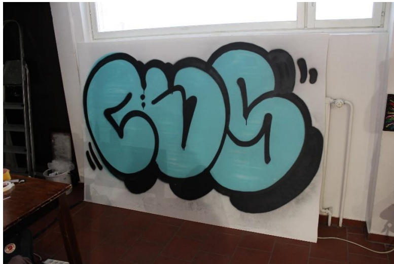
Paikallista tyyliä oleva graffiti vanerilevyllä.

Näyttelyssä oli useammalla seinällä töitä, jotka oli aseteltu edustamaan perinteisempää taidenäyttelylle ominaista tyyliä. Oli teoksia, joita oli tehty pahville ja kanvakselle, mutta myös laitettu kehyksiin. Lisäksi oli kaksi vanhaa opetustaulun tapaista kuvaa, joihin oli maalattu päälle graffiteja osaksi alkuperäisen kuvan miljöötä. Feelinx-nimeä yllään kantava teos hiirestä taas paljasti maalin alta Laajavuoren camping-alueeseen viittaavaa tekstiä, eli taulupohja on luultavasti aikoinaan toiminut Laajavuoren infokyltinä. Suurin osa kyseisistä teoksista oli myynnissä, mikä kuvasti että teokset oli tehty loppuun asti valmiiksi, mutta myös galleriatoiminnan kaupallista puolta. Myynnissä oli myös graffitein koristellut t-paita ja farkkuliivi sekä kopioita joistain valokuvista.