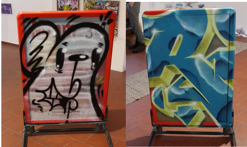
Hesburgerin mainoskytti molemmin puolin.