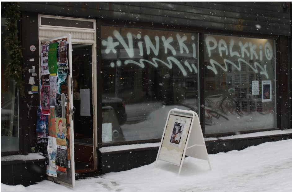
Näyttelytila ulkoa päin.

Millainen näyttely Vinkkipalkkio oli ja miten se jyväskyläläistä graffitiä ja katutaidetta esitteli? Ennen itse näyttelyyn tutustumista kiinnitin huomiota näyttelyjulisteeseen ja tapahtuma-aikatauluun, jotka oli tyylille omistautuneesti, tosin juliste vain osin, tehty tussia käyttäen. Myös gallerian ikkunaan oli näyttelyn nimi tehty spraymaalilla hyödyntäen. Sisälle astuessa näyttelytila oli pieni, mutta materiaalia oli runsaasti tarjolla. Näyttelyyn ei kuitenkaan sisältynyt näyttelyesitettä ja tekijöiden anonymisuus oli graffitille tyyppillisesti säilytetty: jäljellä oli pelkkä visuaalinen tarjonta.