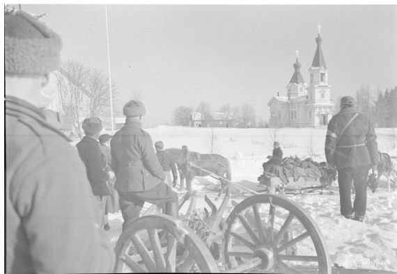
Talvisodan päättymisen jälkeistä evakointia Laatokan pohjoispuolisessa Raja-Karjalassa. Kuva otettu 16.3.1940 Korpiselän ortodoksisen, silloisen kreikkalaiskatolisen kirkon edustalla.

Miksi paikallisväestö sitten ei kertonut avoimesti kaikkea sitä mitä he ajattelivat? Tätä voidaan selittää keruuhetken kontekstista nousevilla tekijöillä. Eräänä keskeisenä kerrontaa ohjanneena tekijänä oli Suomen valtion tuolloin siirtoväen kohdalla odottama solidaarisuuden henki. Neuvostoliitolle luovutetuilta alueilta muualle maahan sijoitettujen suomalaisten koettiin olevan sijaiskärsijöitä muun maan itsenäisyyden säilymisen puolesta. Sijaiskärsijän status taas edellytti kotinsa säilyttäneiltä suomalaisilta ymmärtävää suhtautumista evakoihin ja heidän hyväksyvää kohtaamistaan. [23] Tämän normatiivisen odotuksen tunnistanee ja odotuksen rikkomisesta seuraavan sanktion pelon sisäistäneet haastateltavat vastasivat kysymyksiin omaksumansa solidaarisuusodotuksen luomissa rajoissa.