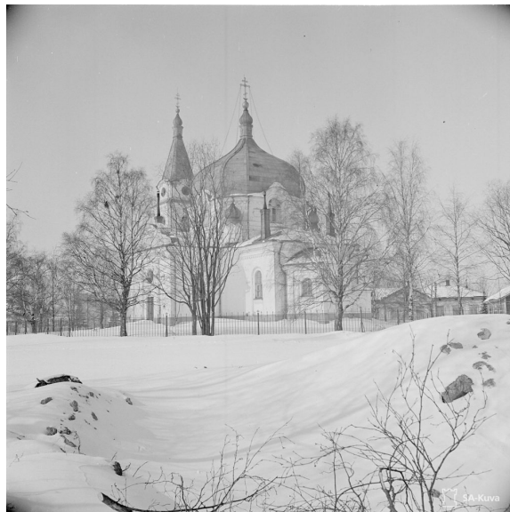
Sortavalan kreikkalaiskatolisen seurakunnan kirkko Suomen ja Neuvostoliiton välisen talvisodan päättymisen jälkeen maaliskuussa 1940. Alueluovutusten jälkeen Sortavalan seurakuntaa jatkamaan perustettiin Jyväskylän ortodoksinen seurakunta vuoden 1950 alussa. Ennen sotia Sortavala oli Suomen ortodoksisen kirkkokunnan virallinen keskus vuodesta 1925 alkaen. Myös ortodoksinen pappisseminaari sijoittui Sortavalaan jo vuonna 1918.