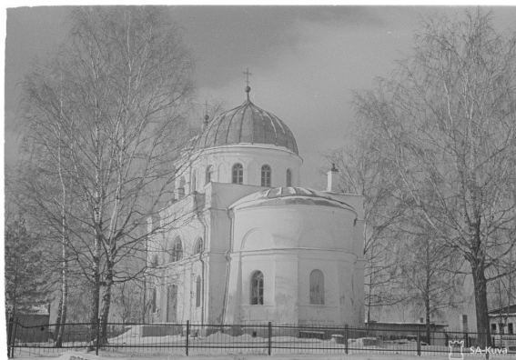
Myös Käkisalmissa, Laatokan pohjoisrannalla sijainneesta Sortavalasta etelään oli ortodoksisia pyhäköitä. Marraskuussa 1941 kuvattiin niistä yksi, 1800-luvun puolivälissä rakennettu ja Neitsyt Marian syntymälle pyhitetty kirkko.

EPL:n toimitusmäärien kasvua selittävänä tekijänä ilmeni 1970-luvulla myös varsin käytännöllisiä syitä – uusi palveluskäsikirja julkaistiin vuonna 1971. Myös palveluksen tavoitettavuutta lisättiin sekä helpottamalla paastosääntöjä että siirtämällä palveluksen toimitusajankohta iltaan, jolloin työssä käyvien seurakuntalaisten mahdollisuudet osallistua EPL:aan paranivat. EPL-liturgiaa toimitettiin erityisen paljon siirtoväen uusien asuinseutujen seurakunnissa. Toimituksella haluttiin rikkoa väestön keskuuteen syntyneitä ehtoolliskielteistä asennoitumista. Kenties EPL olikin myös seurakuntatyönväline alueilla, joilla ortodoksinen siirtoväki oli aloitellut sodanjälkeistä elämäänsä luterilaisen valtaväestön paineessa.