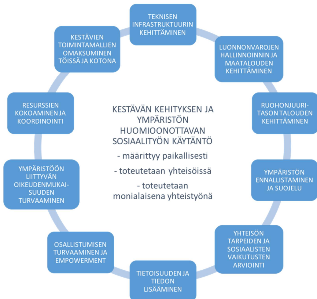
KUVIO 1. Ympäristön ja kestävä kehityksen huomioon ottavan sosiaalityön käytäntö

Tämän tutkimuksen tavoitteena on tarkastella sosiaalityön ja ympäristön suhdetta sekä erityisesti sitä, millaisena ympäristökysymykset ja kestävä kehitys huomioivat sosiaalityön käytännöt näyttäytyvät systemaattisen kirjallisuuskatsauksen avulla. Monet toiminnoista ovat ominaisia sosiaalityölle yleensä, mutta aineistossa niitä sovelletaan vastaamaan paitsi sosiaalisin myös luontoon ja ympäristöön sekä kestäväan kehitykseen liittyviin tavoitteisiin. Tulokset on tiivistetty seuraavaan kuvioon 1, jossa ulkokehälle on kuvattu sosiaalityön toimintamuodot ja kehän sisälle sen erityispiirteet.