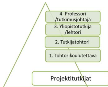
Kuvio 1. Neliportainen tutkijanuramalli ja siihen kuulumattomat projektitutkijat.

Ongelmana neliportaisessa tutkijanuramallissa nähtiin arvioinnin mukaan se, että malliin sisältyy vain osa akateemisesta tutkimus- ja opetushenkilökunnasta. Esimerkiksi ulkopuolisella rahoituksella työskentelevät projektitutkijat eivät virallisesti kuulu mallin sisälle. Useissa yliopistoissa kuitenkin kaikki maisterin tutkinnolla ja tutkimus- ja opetustehtävissä työskentelevät on sijoitettu ensimmäiselle portaalle. Yliopistojen henkilöstö on kokenut neliportaisen tutkijanuramallin sisältävän lupauksen uralla etenemisestä, vaikka uralla eteneminen käytännössä tapahtuu aina avoimen paikan hakemisen kautta. (Välimaa ym. 2016.)