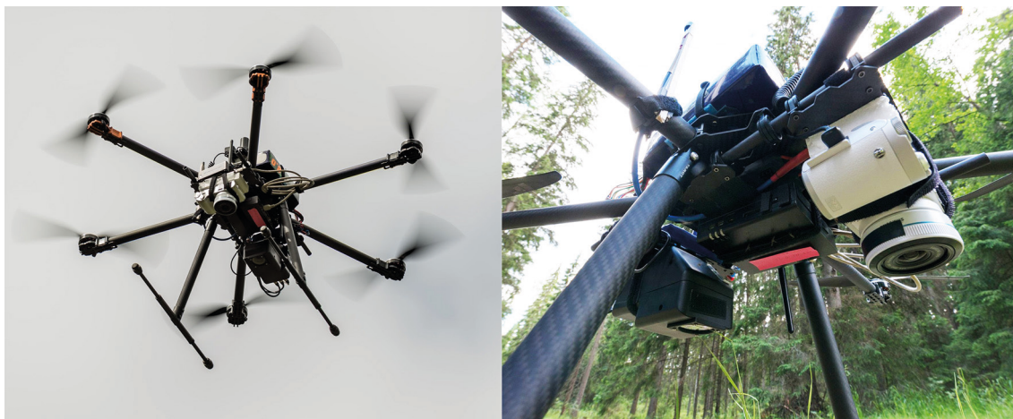
Kuva 1. Maanmittauslaitoksen Paikkatietokeskuksen UAV-kuvauslaitteisto: Tarot 960 UAV-multikopteri (vasemmalta) ja siihen asennetut RGB- ja hyperspektrikamera (oikealla).

aallonpituusalueilta n. 500–900 nm. Tutkimuksessa käytetty UAV-lentolaite ja siihen asennettu sensorikombinaatio on havainnollistettu kuvassa 1.