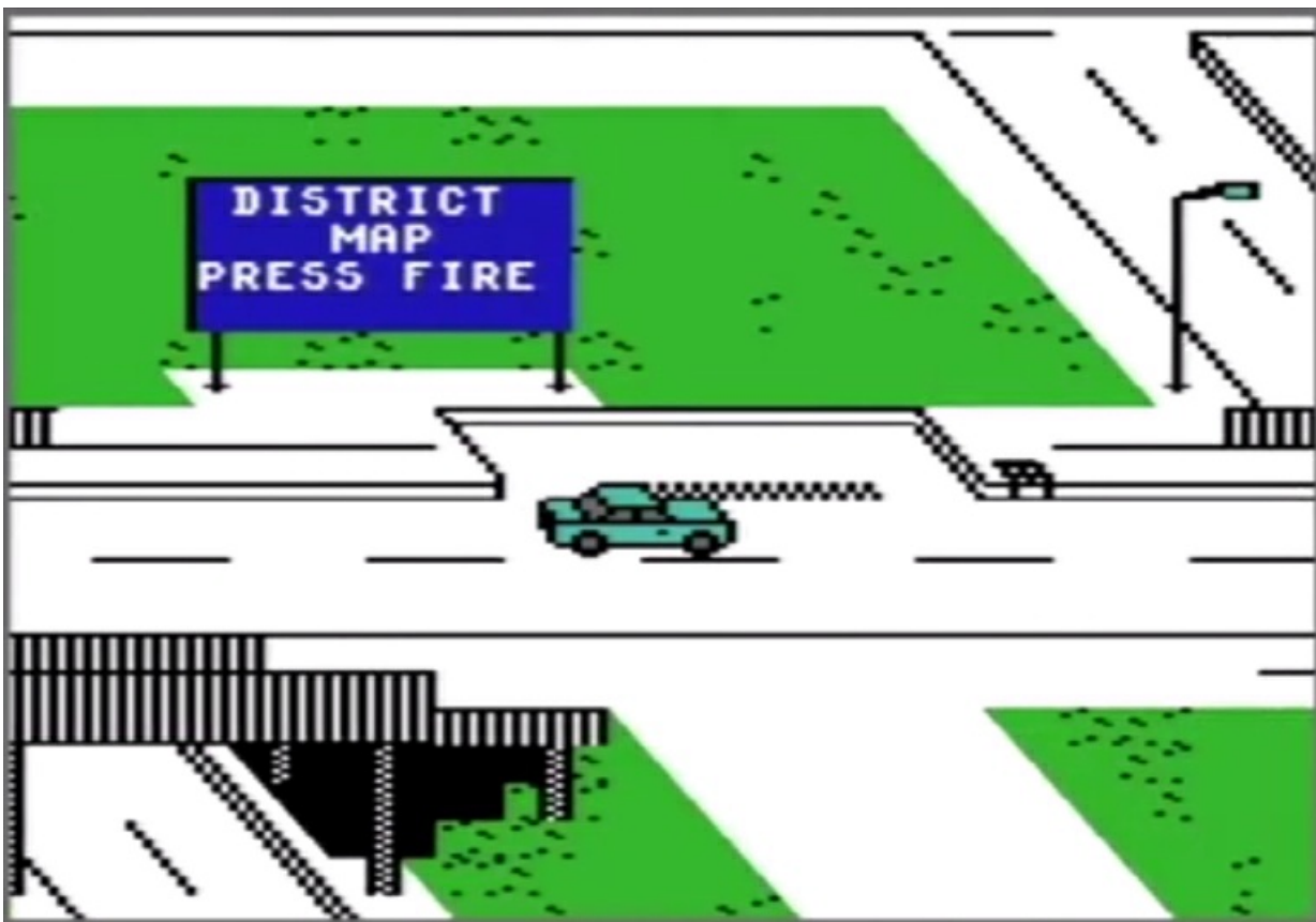
Traffix Lähde: Pelataanpa: Kuusnepamuiстоja – Youtube

No mikä tykkäsin tästä? No tää on kauheen rauhallista ja koska mä olen kauheen huono pelaaja, mitä oon tietysti nytki, nii semmonen kauheen raivoisa toiminta ei oikeen vedonnu ja tässä oli vähän ajatteluakin, et piti keksiä et missä se on se lähetin.