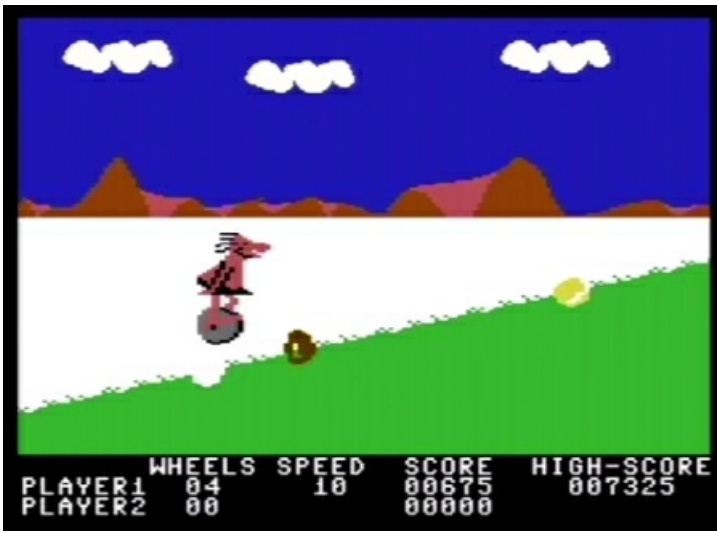
BC's Quest for Tires

Pulteri kuuluu selvästi pelaajakertojan mielestä vaikeampaan päähän Commodore-pelejä, joten videolla esitellään myös rauhallisempi peli, Traffix [45]: