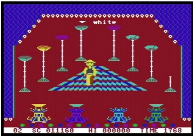
Chinese Juggler Lähde: Pelataanpa: Kuusnepamuistoja – Youtube

Se mitä tässä koko ajan vahingossa tekee on se, että heittää tota lautasta ilmaan mikä vaihtaa sen väriä... ja tässä on vähän vaikeaa aina tietää sitä paikkaa mihin toi lautanen sovitetaan.