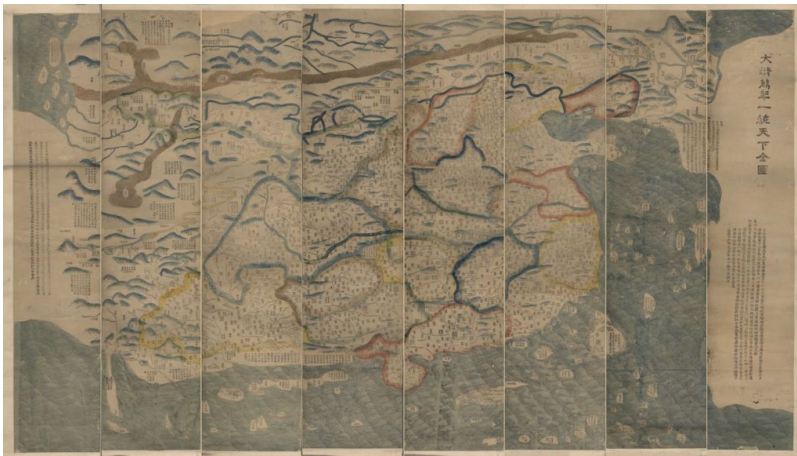
Qing-dynastian aikainen kartta (Da Qing wan nian yi tong tian xia quan tu) esittää "kaikkea taivaan alla". Kiina on valtavana jättiläisenä "neljän meren keskellä". Muut valtiot ovat pieniä sivumainintoja reuna-alueilla.

Tianxiassa kungfutselainen järjestelmä laajennettiin koskemaan Kiinan ulkosuhteita siten, että Kiinan keisari, "taivaan poika" (天子, tianzi ), oli järjestyksen ylin auktoriteetti, koska jumalankaltainen kosminen voima, taivas, oli myöntänyt hänelle "taivaallisen mandaatin" hallita maanpäällisiä asioita. Kaikki taivaan alla kuului keisarin alaisuuteen, eikä järjestelmällä siten tarvinnut olla ulkoisia rajoja. Fyysisesti maailman ajateltiin olevan neliskantinen: kaiken keskellä sijaitsi keskuksen valtakunta ja sen ympärille rakentui useita sisäkkäisiä kehä, jotka kuvasivat keskuksen moraalisen auktoriteetin heikkenemistä niin, että uloimmalla ja kaukaisimmalla kehällä asuivat tyystin sivistymättömät barbaarit. Tianxiassa kuului keskeisesti ajatus, jonka mukaan keisari voi omalla hyveellisyydellä säteilevällä esimerkiksi näin vähitellen sivistää reuna-alueiden barbaarit, jolloin sivistyksen kehät laajenivat yhä kauemmas. [24]