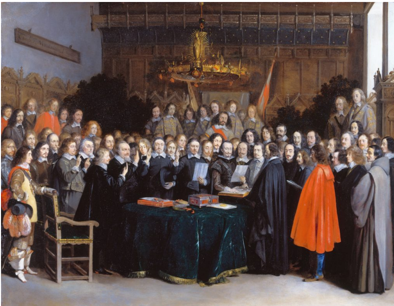
Westfalenin rauhansopimuksessa luotiin pohja länsimaiselle, kansallisvaltioihin ja niiden väliin suhteisiin perustavalle kansainväliselle järjestelmälle. Gerard Terborchin rauhansopimuksen allekirjoittamista kuvaava maalaus on vuodelta 1648.

Westfalenilainen kansallisvaltioihin pohjautuva järjestelmä levittäytyi sittemmin länsimaisen kolonialismin myötä koko maailmaan peittäen alleen muunlaiset järjestelmät. [14]