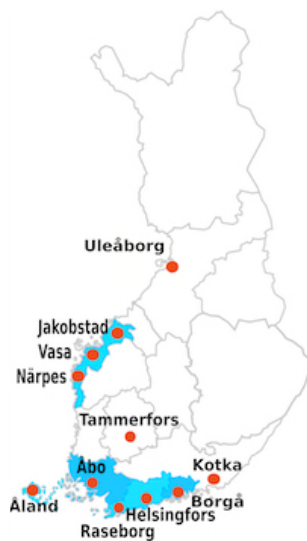
FIGUR 1: Svenskfinland 1

Svenskfinland kan ses som en geografisk region (se figur 1) och även som en symbol för en kultur- och identitetskonstruktion, där man skiljer sig från finskspråkiga (Liebkind & Sandlund 2006). Svenskfinland kan grovt sett delas upp i en nordlig del (Österbotten) och en sydlig del (Åland, Åboland och Nyland) och i dessa delar finns såväl enspråkigt svenska som tvåspråkiga kommuner. Då svenskan i praktiken är i minoritetsställning 2 i Finland är principen om kulturell autonomi viktig: Det finns en rik svenskspråkig föreningskultur, gott om svenskspråkiga medier, samt svenskspråkiga skolor och högre utbildning (Kreander & Sundberg 2007). Svenska folkpartiet, Svenska kulturfonden och Folktinget är viktiga aktörer i Svenskfinland som verkar för svenskans och finlandssvenskars bästa och åtnjuter ett högt förtroende (Liebkind & Sandlund 2006).