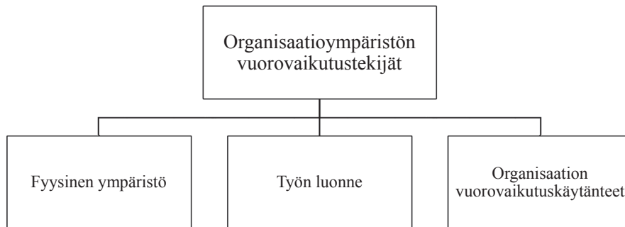
Kuvio 2. Kuulumista ilmentävät organisaatioympäristön vuorovaikutustekijät.

Tässä työyhteisössä kahvihuone oli tarkoitettu kaikkien yhteiseksi tilaksi, mutta työntekijät nostivat esille sen, etteivät lääkärit käytä tätä tilaa. Näin ollen lääkäreiden erottautuminen fyysisestä tilasta symboloi erontekoa myös ammattikuntien välillä. Tämä ero vahvistuu vuorovaikutuksessa, joka toteutuu fyysisessä ympäristössä. Yhteisessä kahvihuoneessa olisi mahdollista lähentää eri professioiden välistä etäisyyttä ja lisätä työyhteisön yhteisöllisyyttä, kuten alla olevassa aineistoesimerkissä kuvataan: