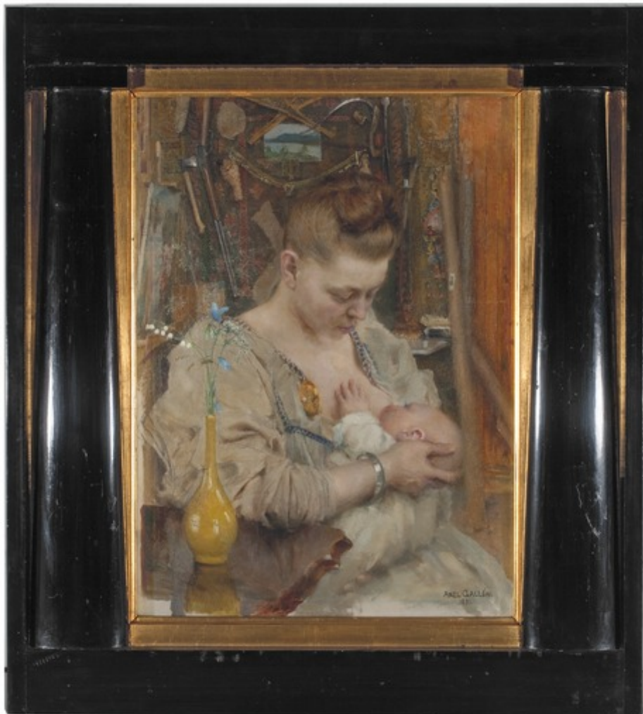
Axel Gallén, Madonna, öljy kankaalle (1891).

Karjalaan pari vuotta ennen teoksensa valmistumista ja kuvasi teoksessaan vaimonsa Maryn ja tyttärensä Impi Marjatan. Munchin tummasävyisempi, erotiikan ja kuoleman säikeitä yhdistävä Madonna -maalaus puolestaan kytkeytyy pohjoismaisen mytologian sijasta eteläeurooppalaiseen madonnakuvastoon, symbolistiseen kirjallisuuteen ja darwinistiseen materialismiin. Charles Darwin (1809-1882) julkaisi pääteoksensa Lajien synty vuonna 1859, mutta Munch innostui evoluutioteoriasta erityisesti Ernst Haeckelin (1836-1919) monistisen ajattelun kautta. Vaikka madonnateema on eri aikakausina ja eri taidesuuntausten yhteydessä saanut moninaisia ilmenemismuotoja, muuntui madonnakuva radikaalisti maallisemmaksi juuri 1800-luvun lopun symbolismin yhteydessä, muun muassa Charles Baudelairen (1821-1867) lyriikassa ja Munchin taiteessa. Artikkelissa tarkastelen Gallénin ja Munchin madonna-aiheista avautuvia näkökulmia 1800-luvun lopun käsityksiin materiaalisuudesta.