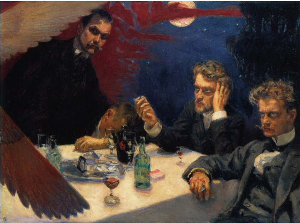
Axel Gallén, Symposion , öljy kankaalle (1894).