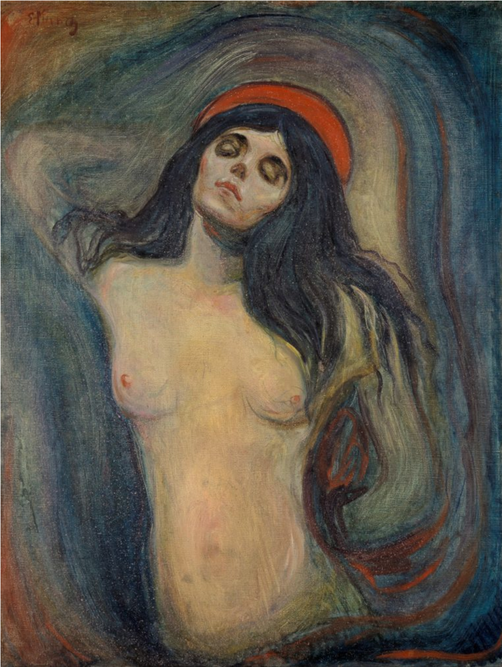
Edvard Munch, Madonna , öljy kankaalle (1894).