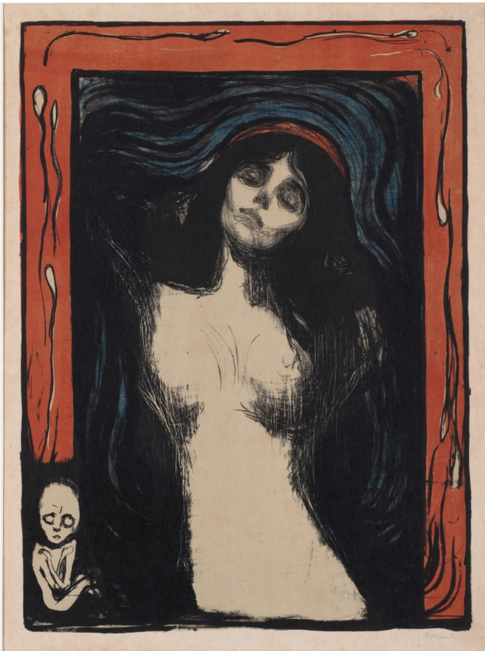
Edvard Munch: Madonna, litografia (1895-1902).

Munch teki myös madonna-kuvastaan lukuisia versioita. Teoksesta on säilynyt viisi öljyväri-versiota, jotka suurissa linjoissaan muistuttavat toisiaan. Lisäksi yksi muista maalausversioista hieman poikkeava öljymaalaus on kadonnut, eikä sen nykyinen olinpaikka ole tiedossa. Ei ole täysin varmaa, mikä versio Munchin Madonna -teoksesta oli esillä missäkin näyttelyssä, esimerkiksi Berliinin yhteisnäyttelyssä vuonna 1895. Maalausten lisäksi Munch työsti madonna-aihetta myös piirrosten ja grafikan keinoin, ja aiheeseen liittyvistä litografoistaan taiteilija teki lukuisia erilaisia värimuunnelmia. Vedoksia ympäröi usein kehyksen rajaama alue, jossa on kuvattu sikiö ja siittiöitä – viitteenä hedelmöittymisen aihepiiriin. [24]