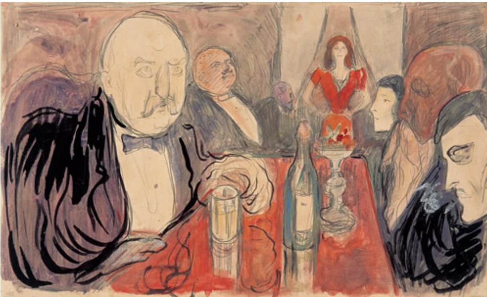
Edvard Munch, Kristiania-boheemit, piirros (1895).