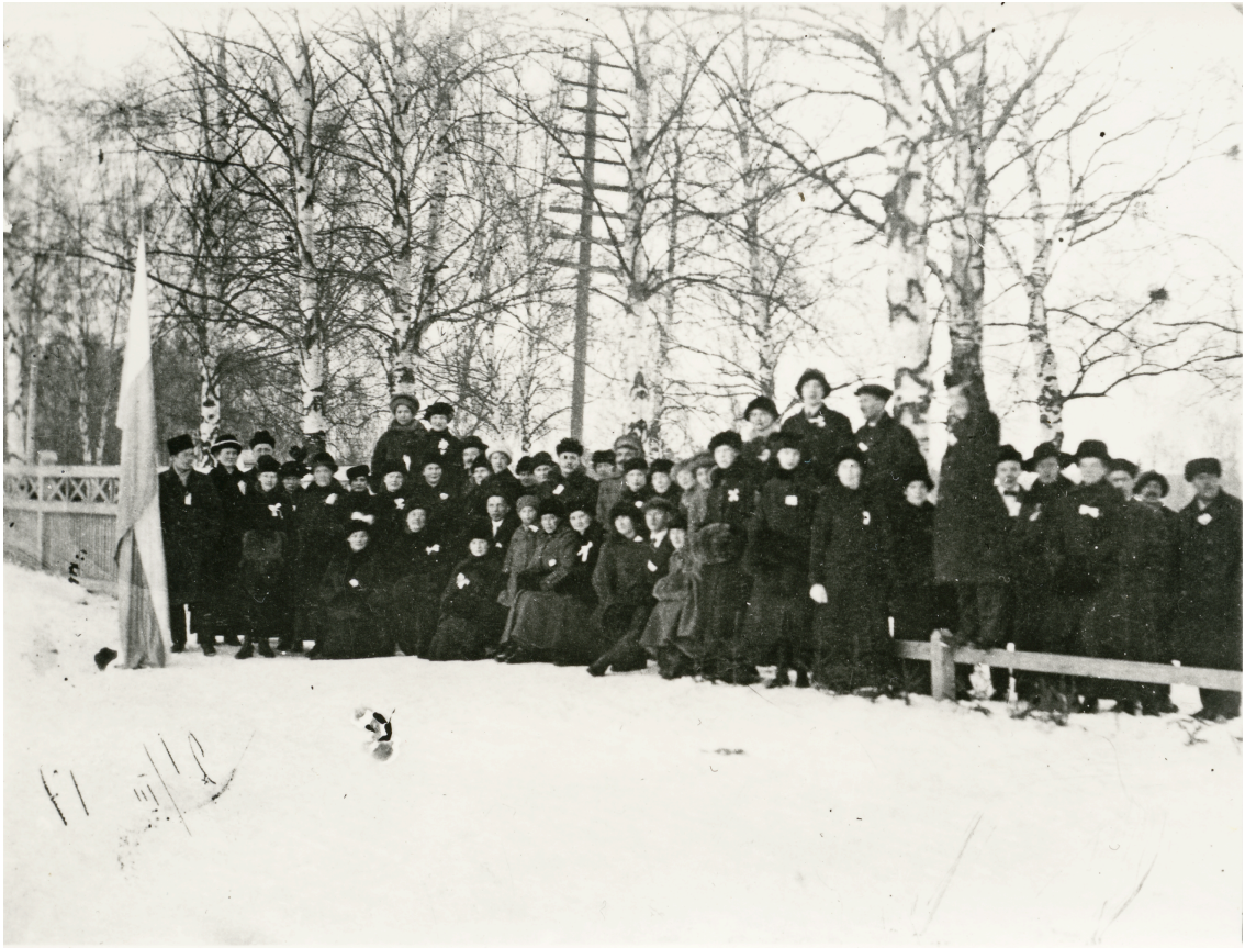
Kuva 4. Jyväskylän nuorisoseura juhlii maaliskuun manifestia.