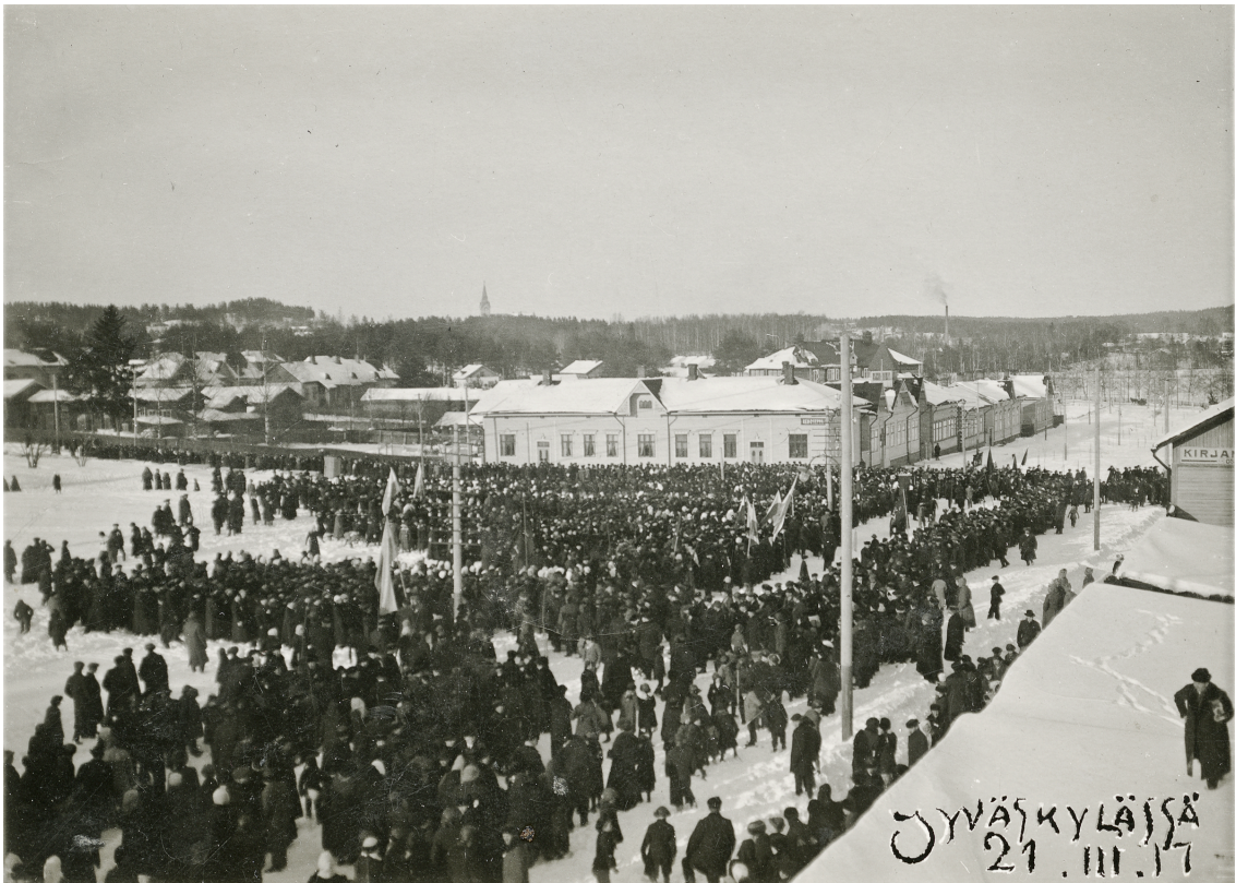
Kuva 3. Maaliskuun manifesti saapuu Jyväskylään 21. päivänä maaliskuuta 1917.

Huhtikuun loppupuolella Jyväskylässä pidettiin mielenosoitus kahdeksan tunnin työpäivästä. Mielenosoituksessa työläiset vaativat kahdeksan tunnin työpäivän toteuttamista kaikissa töissä ja kaikilla aloilla. 478 Mielenosoituksella haluttiin vauhdittaa vaatimusta lyhyemmästä työpäivästä, sillä kysymys oli huhtikuussa työväestön kaikkein tärkein vaatimus. Huhtikuun 29. päivänä Jyväskylä työväenyhdistyksen talolla oli järjestäytyneen työväen joukkokokous. Siellä käsiteltiin kaupungin elintarvekysymyksen järjestämistä. Kokouksessa valittiin viisimiehinen toimikunta valvomaan elintarviketilannetta kaupungissa. Sen lisäksi kokouksessa käsiteltiin kahden poliisin erottamiskysymystä, sillä he eivät nauttineet työväestön luottamusta. Molempien poliisien antamat selitykset luettiin ja asiassa päätettiin jäädä odottavalle kannalle sekä katsoa heidän toimiaan ja tarpeen tullen ryhtyä lisätoimenpiteisiin. 479 Työväestö ei väkisin vaatinut poliisien erottamista, sillä käyttämässani lähteissä ei ole viitteitä siitä, että poliisien erottamisiin olisi kaupungissa ryhdytty.