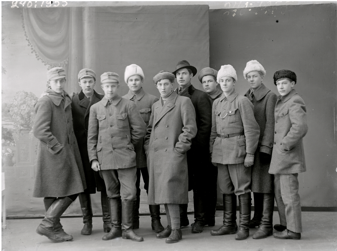
Kuva 2. Lyseon suojeluskuntalaisia. (Keski-Suomen museon kuva-arkisto)

Sanomalehti Keski-Suomi uutisoi ensimmäisen kerran tiistaina 20. päivänä marraskuuta suurlakon aikaisista tapahtumista kaupungissa. Se kertoi, että lyseolle saapui perjantaina iltapäivällä kello yhden aikaan suuri punakaartilaisosasto, joka esti koululaisten pääsyn kouluun, mutta muissa kouluissa ei ryhdytty yhtä jyrkkiin toimenpiteisiin, joten ne olivat toiminnassa kaiken aikaa. 403 Tiukan vartioinnin seurauksena lyseo suljettiin kahdeksi päiväksi ja koulutyö pääsi jatkumaan marraskuun 20. päivästä eteenpäin. 404 Seminaarin sulkeminen ja lyseon tarkka vartioiminen ovat seurausta siitä, että osa koulujen opettajista ja oppilaista olivat mukana suojeluskunnan toiminnassa. Seminaarille oli perustettu suojeluskuntaosasto liikunnan ja voimistelun lehtori Vartian johdolla lokakuun puolivälissä. 405 Sanomalehti Sorretun Voima otti