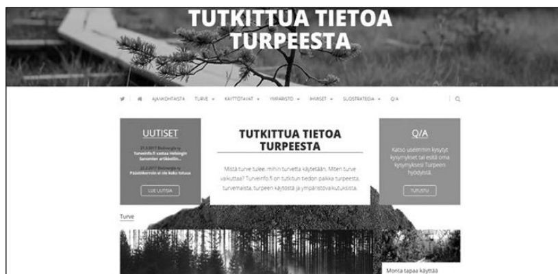
Kuva 2: Turveinfo.fi sivusto. Sivusto on päivitetty analyysin jälkeen, joten kuva ei täysin vastaa kuvausta.

Turveinfo.fi-etusivun rauhallinen, murrettujen värien hallitsema valokuva suosta ja pitkospuista – suomalaisen (mielen)maiseman representaatio – on yhtä yleisesti jaettu kuva suomalaisuudesta kuin järvimaisema, lumiset puut tai Koli. Suokuvan päällä on sivuston pääotsikko ”Tutkittua tietoa turpeesta”. Sen alla näkyvät sivuston osastot: Ajankohtaista, Turve, Käyttötavat, Ympäristö, Ihmiset, Suostrategia, Kampanja, Q/A.